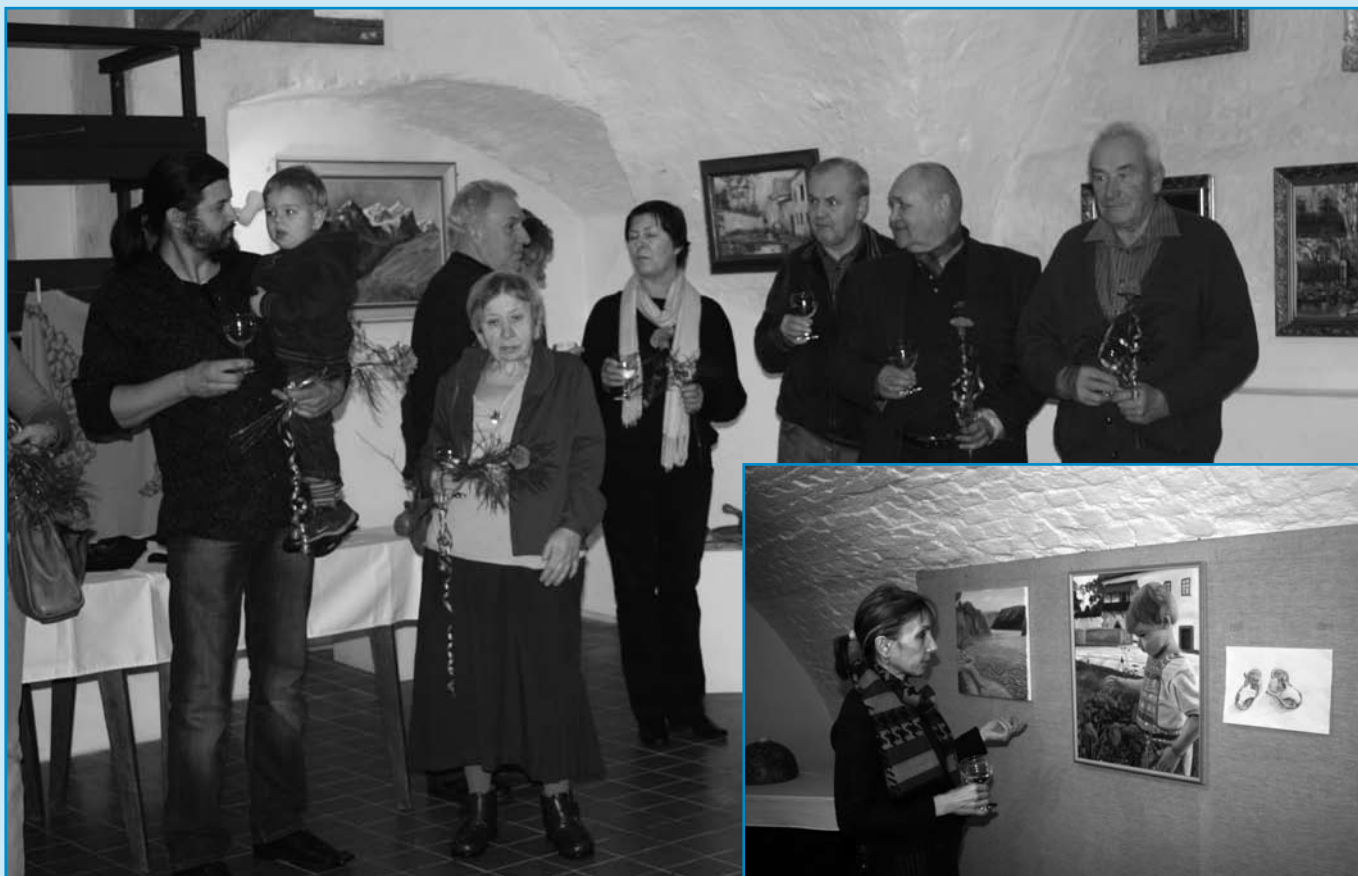
8. ledna proběhla slavnostní vernisáž výstavy Výtvarníci Milevska a okolí, kterou můžete v Galerii M shlédnout až do 24. února.