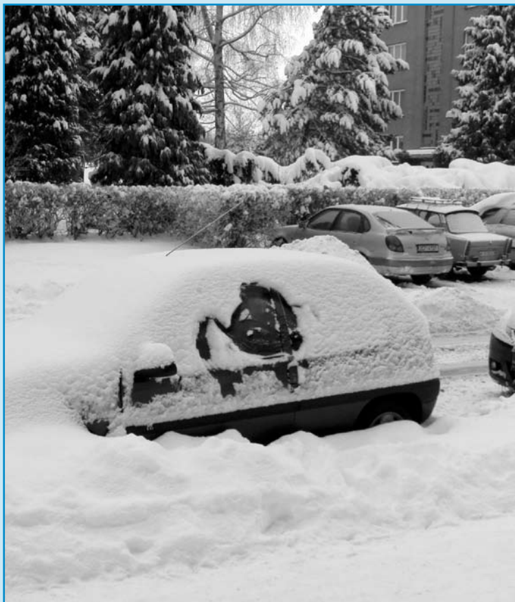
Lednové přívaly sněhu způsobily starost hlavně motoristům ...