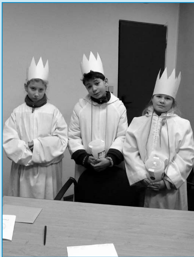
Tři králové zavítali 6. ledna i na milevskou radnici.