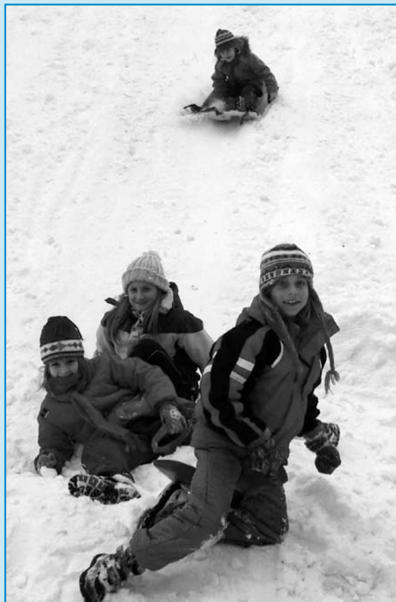
... dětem však udělaly velikou radost!