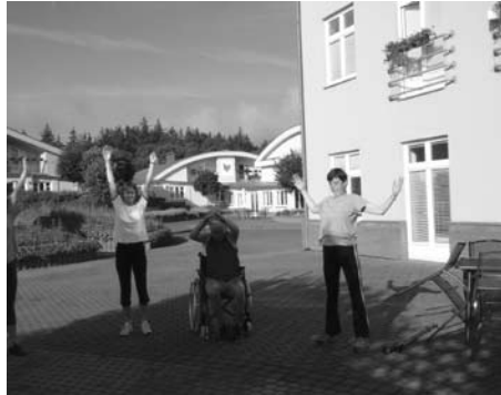
Každodenní ranní rozcívka členů Rosky při rekondičním pobytu v pečovatelském domě pro postižené lidi v Mačkové u Blatné.

táborské pobočce). Nechybí také chvilky cvičení a relaxace v bazénu, hipoterapie a masáže. Našli se i dobří přátelé, kteří občas zajistili zpestření pobytu ochotnickým divadelním představením nebo návštěvou astrologa, umělecké fotografky či akademického malíře. Jako každá jiná organizace se však potýkáme s nedostatkem peněz