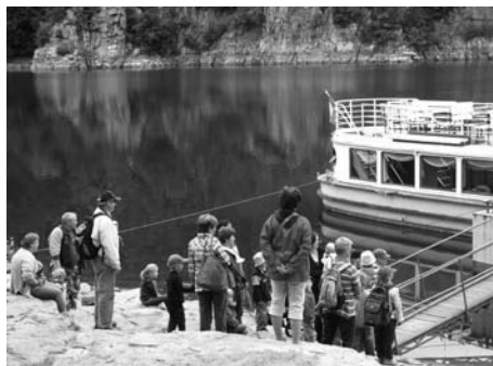
Děti s maminkami připravené k nástupu na cestu ze Zvíkova na Orlik

šení. A následky takového způsobu života se potom odrazí formou vyhaslých nadějí, rozčarováním a jen těžko se mladý člověk znovu zvedá a pátrá po tom, co je důležité. Hledá hodnoty, o kterých nikdy neslyšel, a to bohužel až v době,