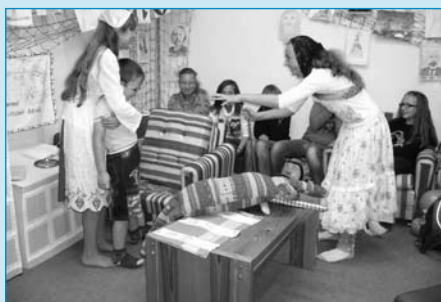
V milevské městské knihovně proběhla Pocta K. J. Erbenovi – báseň Poledníci ztvárnili žáci VI. B.