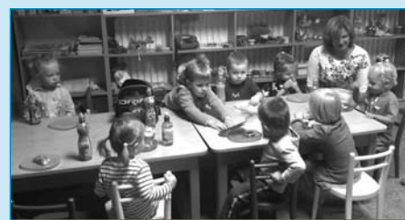
Dětem se v mini-školce v Centru Milísek líbí.