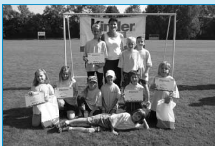
Družstvo žáků 1. stupně 2. ZŠ J. A. Komenského Milevsko obsadilo v krajském kole lehkootletické soutěže Kinderiády v Nové Včelnici 3. místo. Vybojovalo si tak postup do červnového republikového finále do Prahy.