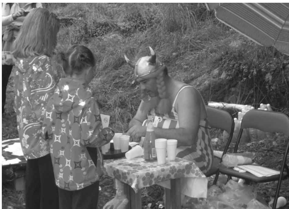
Přes 700 návštěvníků zavítalo na 3. Pohádkový les v Milevsku. Více informací na str. 12.