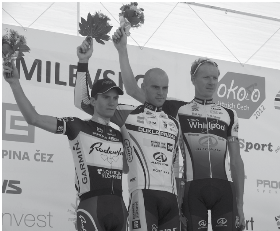
V pátek 7. září proběhl v Milevsku dojezd 1. etapy závodu Okolo jižních Čech. Svým vystoupením ho zpestřila zpěvačka Heidy Janků a bříšní tanečnice z Domu dětí a mládeže v Milevsku. Na snímku jsou vítězové této etapy při slavnostním vyhlášení.