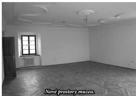
Nové prostory muzea.

Za minulých staletí, a zejména v době socialismu, sloužily zdejší historicky a kulturně cenné budovy jako stodoly, sušárna obilí, unikátní románský konvent pak jako sklad či pěstírna žampionů. Viditelným výsledkem neviditelné hodnotové devastace, která zmíněné kulturně hodnotné budovy dovolila využít jako stodoly a sklady, je pak jejich současný žalostný stav. Domníváme se, že přestěhováním tak důležité instituce, jakou je městské muzeum, do budovy,