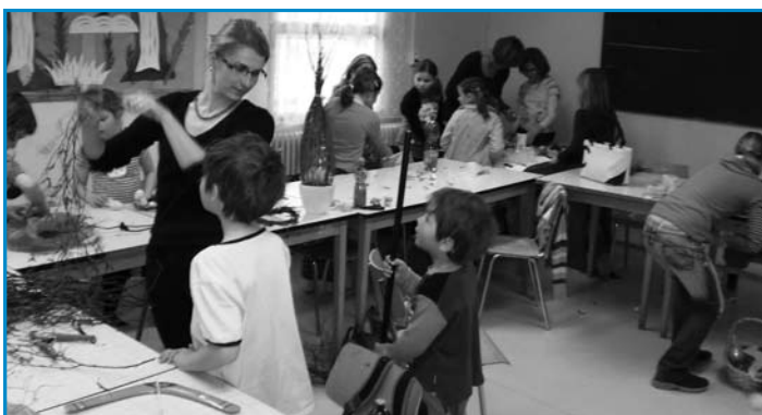
Velikonoční prázdniny v DDM Milevsko. Děti malovaly kraslice, pletly pomlázky, zdobily perníčky, pletly věnce z proutí a hledaly pomlázku, kterou jim nechal zajíček. Poté se spokojené rozešly domů.

Sbírka sportovního náčiní pokračuje - Pokud máte doma již nepotřebné kolo, koloběžku, tříkolku či cokoli jiného, co má pojízdná kolečka a na čem by mohly děti v rámci Kolečkového dne soutěžit, je možné toto přivést v provozní době do kanceláře DK Milevsko. Organizátoři dále hledají pomocníky na stanoviště a pořadatelskou službu z řad veřejnosti, rodičů, studentů. Odměnou bude uznání, dobrý pocit a občerstvení. Zároveň uvítají pomoc sponzorů, díky jejichž příspěvku se akci podaří zrealizovat. Číslo účtu, na který mohou případní sponzoři přispívat je 1202728782/2310. Více informací na tel. +420 775 369 012.