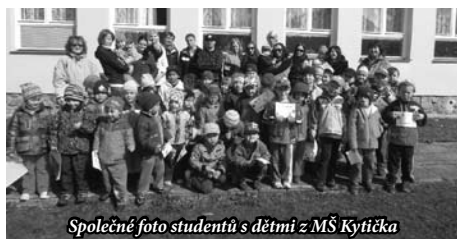
Společné foto studentů s dětmi z MŠ Kytíčka