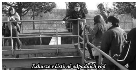
Exkurze v čistírně odpadních vod

a předmětů z odpadových materiálů. Třídy SO2 a TOP3 se vydaly uklídit po zimě okolí Milevska. Lokality byly vybrány ve spolupráci s Městským úřadem – odborem životního prostředí. Třída SP3 prozkoumala rozmístění kontejnerů na odpad v okolí školy a v anketě i znalosti obyvatel Milevska v oblasti třídění odpadu. Třída MEP3 si připravila zábavné dopoledne pro děti z Mateřské školky Kytíčka. Spokojené byly nejen děti, ale i studenti, kteří aktivity řídili. Třída KP3 prověřila svoje znalosti o přírodě v soutěžích, doplňovačkách i křížovkách. Celý den se vydařil i díky krásnému počasí. Všichni se už těší na další projektové dny, které budou v příštím školním roce.