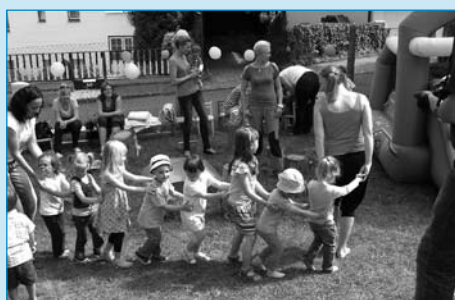
V Milísku se slavil den dětí nadvakrát. Jednou na cvičení rodiče + děti a podruhé při Rozzářeném dni dětí na zahradě, kde na ně čekalo překvapení v podobě nového skákacího hradu (lokomotiva), dětské diskotéky a veselého malování na obličej.