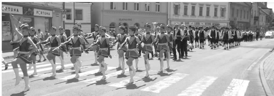
Součástí festivalu byl průvod z nám. E. Beneše do parku Bažantnice, kde se konal hlavní program.