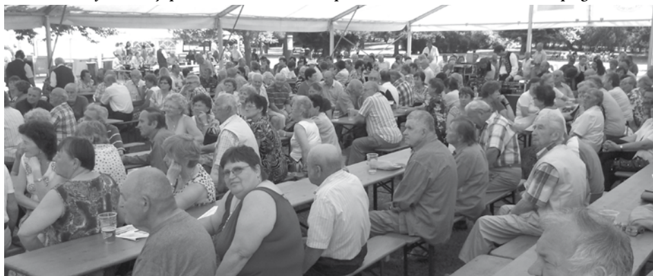
Mezinárodní festival dechových kapel si nenechalo ujít cca 500 návštěvníků.