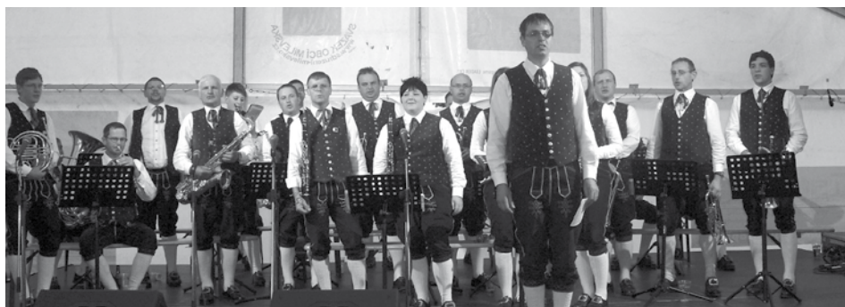
Kapela Musikverein Oepping při vystoupení v Milevsku.