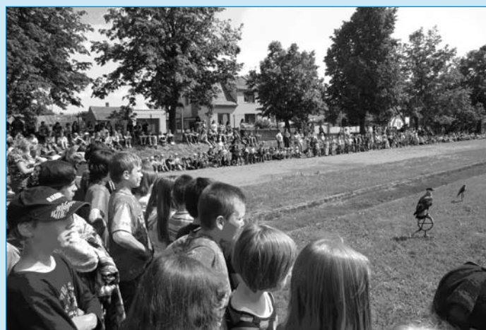
Pro velký úspěch v minulosti zajistili pedagogové milevských základních škol za finančního přispění města pro své školáky i děti mateřských škol k mezinárodnímu dni dětí oblíbenou akci společnosti ZAYFERUS z Kuřimi. V rámci programu se dětem představili mnozí známí i méně známí zástupci ptačí říše. Spolu s doprovodnými soutěžemi, ukázkami letu a lovu kořisti se děti dozvěděly mnoho zajímavostí ze života ptáků. Akce „Dravci“ bývá vždy dětmi i dospělými hodnocena jako jedna z nejlepších.