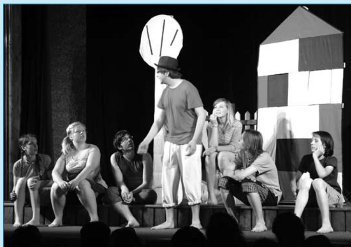
Divadelní soubor Tábor sehrál v Domě kultury ke dni dětí pohádku Měla babka čtyři jabka.