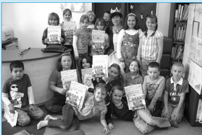
Městská knihovna se zúčastnila již čtvrtého ročníku projektu na podporu čtenářské gramotnosti Už jsem čtenář – Knížka pro prvňáčka. Hlavními sponzory projektu jsou nakladatelství Triton a SKIP ČR. Cílem projektu je rozvoj čtenářských návyků žáků již od prvního ročníku školní docházky. Děti dostaly knížku Miloš Kratochvíla Školníci. Na fotografii jsou prvňáčci pasovaní na Rytíře řádu čtenářského.