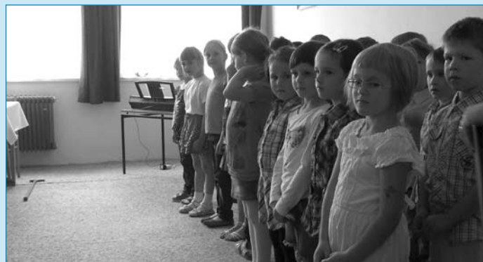
Na snímku děti z MŠ Klubičko, které přišly dne 6. června potěšit seniory svým pásmem říkadel a pohádek nazvaným „Den je slunečný“.