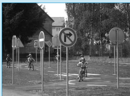
Koncem května bylo v Milevsku otevřeno nové dopravní hřiště pod mateřskou školou Kytička. Děti měly možnost ihned vyzkoušet jízdu na nových kolech.