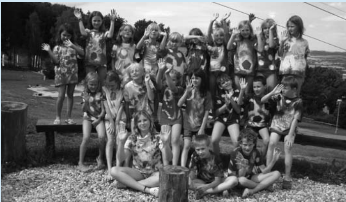
Centrum Milísek v srpnu zdárně ukončilo poslední letní dětské tábory, které mělo připraveno pro děti na letošní léto. Na snímku jsou děti na II. běhu DT Monítec 2012.