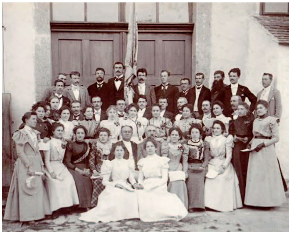
Zpěvácký spolek Vlastislav na snímku z roku 1896.