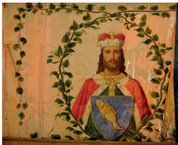
Prapor spolku Vlastislav pochází z roku 1864 (Sbírkový Milevského muzea – foto Lukáš Panec).

Německá okupace však činnost spolku silně omezila a po válce už Vlastislavu chybělo někdejší nadšení. Činnost slábla a dle pamětníků se několik posledních vystoupení konalo roku 1949. Definitivním koncem Vlastislava bylo rozhodnutí referátu pro vnitřní bezpečnost Okresního národního výboru v Milevsku ze dne 3. února 1951. Píše se zde, že spolek nezalasal zdejšími úřady jména představenstva