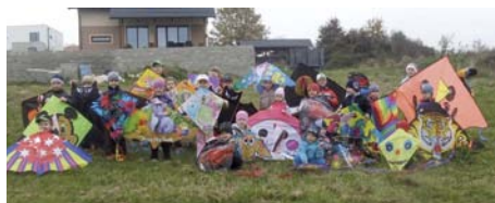
Na snímku děti z MŠ Klubičko.