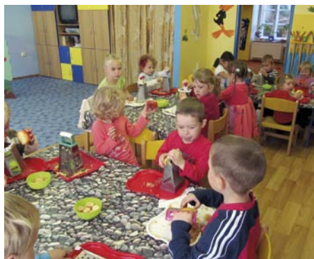
Ve středu 2. října se do školičky v Kostelci nad Vltavou „koulelo, koulelo červené jablíčko... a také zelené i žluté“. Každé z dětí si v tento den přineslo dvě jablíčka, kterými byly motivovány celé dopolední hrátky. Vůně, barvy a tvary jablíček nabídly mnoho nápadů a inspiraci k různorodým aktivitám s nimi. Velkou radost měly děti při strouhání jablek, které smíchaly s piškoty a mohly si na nich pochutnat. Odpoledne zůstala po jablíčkách vyzdobená šatna a třída plná jablečné vůně.