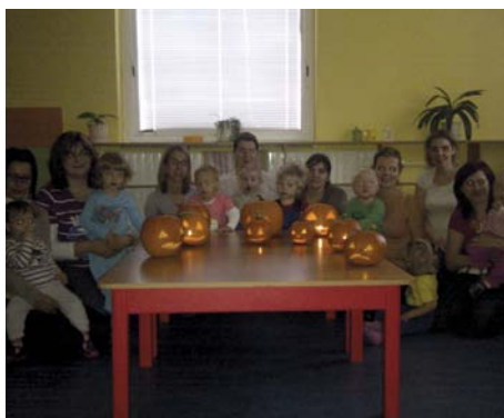
V pátek 11. října si maminky s dětmi v rámci programu cvičení rodiče + děti společně vydabaly strašidýlka z dýní a 8. listopadu nás čeká dopolední halloween karneval.