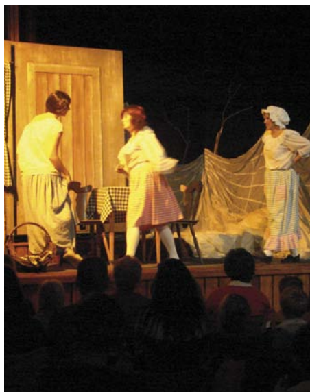
V domě kultury sehráli herci divadla Mladá scéna z Ústí nad Labem ve čtvrtek 10. října pohádku O dvanácti měsíčkách . Děti měly možnost získat za účast na tomto představení razítko Mikulína do kartičky. Další akcí, na které můžete Mikulína obdržet, je dětské představení Hodinka zpívání . Ta proběhne v neděli 3. listopadu odpoledne.