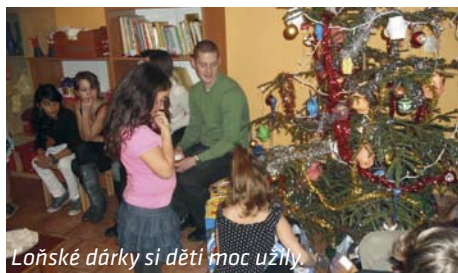
Loňské dárky si děti moc užily.

V loňském roce jsme poprvé uspořádali tuto sbírkovou akci, jejímž cílem je získat vánoční dárky pro děti bez rodičů nebo pro ty, které vzhledem k situaci v rodině nemohou žádné dárky očekávat. Byl to pro nás krok do tmy, protože jsme zatím pořádali vlastně jen sportovní a zábavné akce typu Kolečkový den. Tím větší bylo naše nadšení, překvapení a úžas, když jsme na konci sbírky mohli konstatovat, že se díky občanům města a kraje, sponzorům a firmám podařilo získat dárky pro všech dvacet osm dětí. Kromě toho jsme vyhlásili i veřejnou peněžní sbírku a instituce a jednotlivci uvěřili v náš dobrý úmysl a poctivost a poslali na konto Strom neuvěřitelných 20.200 Kč. Za 3819 Kč jsme nakoupili chybějící a společné dárky, 5461 Kč jsme poslali na účet Charitního domu ve Veselíčku a 10.920