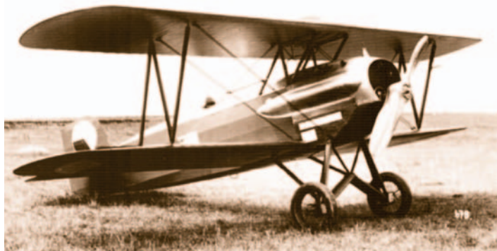
Foto čs. stíhačky Ba-33, která havarovala u Milevska roku 1935.

V dnešní době jsme občas prostřednictvím sdělovacích prostředků konfrontováni s realitou velkých leteckých neštěstí. Ztráty na životech bývají v takových případech veliké a zármutek pozůstalých nekonečný. Leč i v počátcích létání občas došlo k nějaké té nehodě, při níž však byly ztráty na životech nesrovnatelně menší, než je tomu dnes, protože tehdejší dopravní letadla mohla přepravovat jen dost omezený počet cestujících, a co se týče vojenského letectva, tam obvykle byla posádka tvořena jedním či dvěma muži. Navíc tyto malé a vcelku lehké stroje nepotřebovaly při nouzovém přistání zdaleka tolik prostoru jako dnešní dopravní obří, takže až na výjimky se to většinou obešlo bez ztrát na životech.