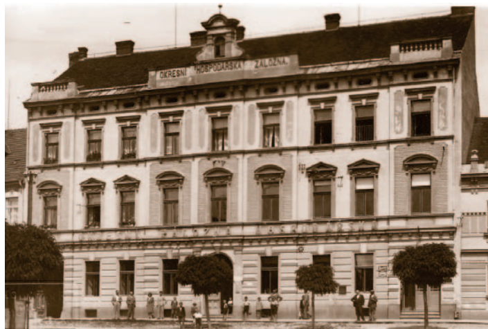
Restaurace v domě hospodářské záložny (nyní budova pošty na milevském náměstí), kam byli oba piloti pozváni milevskými občany na oběd. Snímek z doby I. republiky, ze sbírek Milevského muzea.

K jedné takové letecké nehodě došlo u Milevska na jaře roku 1935. Dne 15. března odstartovala v 9.45 hodin z letiště v Hradci Králové dvě letadla k orientačnímu letu. Pravděpodobně se jednalo o typ Avia Ba – 33. Trasa letu byla plánována z Hradce Králové přes Svratku, Humpolec, Vlašim a následně zpět do Hradce.