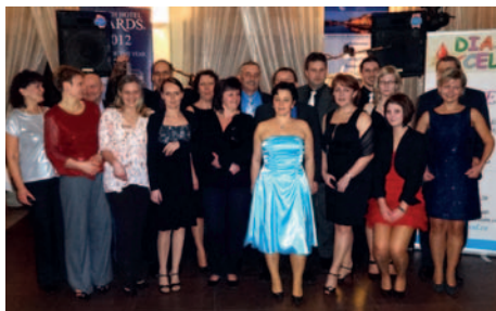
V pátek 10. ledna se v krásném prostředí hotelu Bílá Růže v Písku uskutečnil ples Diacelu, jehož se zúčastnili i členové z Milevska. K tanci i poslechu hrála jako vždy osvědčená kapela Johny Band. V Milevsku se ples Diacelu uskutečnil v sobotu 22. února.