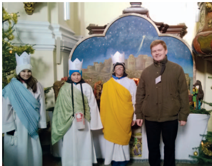
Koledníci ze Sepekova s P. Mikulášem, který dětem obětavě dělal vedoucího skupinky.

V úterý 14. ledna jsme na MěÚ rozpečetili všech 27 pokladniček (z toho tři nebyly použité). Celkový výtěžek činil 91 772 Kč, což je o 2008 Kč více než loni. Pomáhalo nám cca 85 dobrovolníků – dospělých a dětí. Někteří koledovali jen několik hodin, jiní neúnavně i několik dnů, včetně víkendů – každý podle svých možností a sil. Tentokrát se nám bohužel nepodařilo obejít celé Milevsko, ale zase nám pomohli skauti z Chyšek, kteří obešli obce jako je Kvaštov, Hrachov, Radíkov, Voděrady, Nálesí, kus Ratiboře, Záluží nebo Podchyšskou Lhotu. Další koledníci chodili ve Vlksicích, Dobřemilicích, Klisinci, Dobrošově, Pechově Lhotě, v Padařově, v Přeštnici, ve Slabčicích, v Písecké Smolči, Sepekově, Kovářově, v Předbořicích, Květově a v Rukávči. Všechny peníze byly okamžitě odeslány na účet Charity České republiky, odkud se nám později vrátí