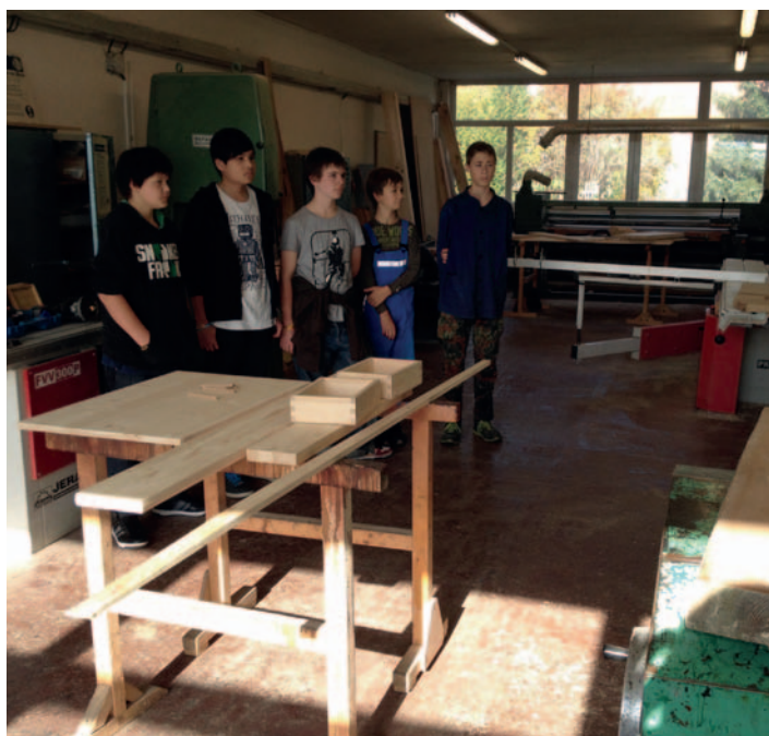
Školní dílna ve Veselíčku, ve které se připravují budoucí truhláři.