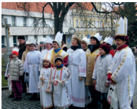
Ve čtvrtek 2. ledna byla před kostelem sv. Bartoloměje na náměstí E. Beneše zahájena Tříkrálová sbírka.