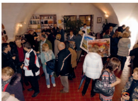
Vernisáž v pátek 17. ledna byla zahájena výstava Výtvarníci Milevska a okolí. V Galerii M ji můžete navštívit do 21. února.