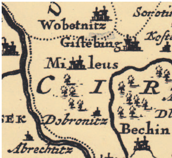
Milevsko (Mileus) na mapě Frederika de Wit z roku 1680.

Další zajímavou mapou v našich muzejních sbírkách je Mapa Českého království, vydaná roku 1680 v amsterodamském nakladatelství Frederika de Wit. Tuto pěknou a výborně zachovalou mapu s kolorovanou parergou koupili v loňském roce pro Milevské muzeum jako dar naši přátelé ze sociální demokracie ve švýcarském Münchenbuchsee. Milevsko zde objevíme pod označením Mileus.