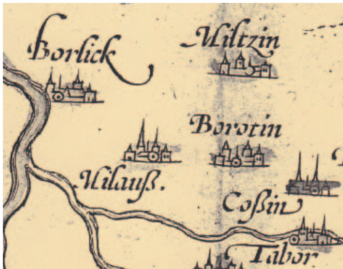
Milevsko (Milaus) spolu s Orlíkem, Borotínem, Košínem a Tábořem na mapě Abrahama Ortelia z roku 1570. Ze sbírek Milevského muzea.

Město Milevsko spolu se zdejším klášteřem je zachyceno na mnoha historických mapách. Poprvé Milevsko nalezneme už na mapě Mikuláše Klaudiána z roku 1518 a také slavná Cosmografie autora Sebastiana Müntera, vydaná poprvé v Basileji roku 1544, na naše město nezapomíná.