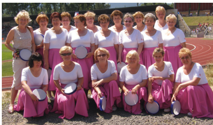
Slet pod Ještědem 2007 - ženy ze sletové skladby To všechno přines čas.

A tak mohla obnovená jednotka v souladu se Zákonem o navrácení sokolského majetku získat zpět sokolovnu, sokolský domek i letní cvičiště u sokolovny již 1. července 1991. Navrácena nebyla pouze část letního cvičiště, na níž je postaven Dům pečovatelské služby. Podle zákona na něj neměla obnovená jednotka nárok. Přesto však došlo k dohodě s Městským úřadem a T. J. Sokol byla převedena nezastavěná část původního sokolského cvičiště s tím, že může sloužit jejímu původnímu poslání. Práce spojené s administrativou a týkající se obnovení jednoty a zajišťování majetku a jeho údržby nenarušily cvičební program. Ten pokračoval plynule pro všechny věkové kategorie, tj. rodiče a děti, nejmladší, mladší a starší žactvo, dorost, muže a ženy. Dětem bylo určeno klasické cvičení všestrannosti, dospělí cvičenci si mohli vybrat z bohatší nabídky: zdravotní tělocvik, cvičení s hudbou, rytmická gymnastika, rekreační volejbal a jógová cvičení. Vybraným žákyním byly určeny specializované hodiny sportovní gymnastiky, dorostencům karate a pro žactvo ještě rytmicko-gymnasticko-taneční cvičení. Ke dni 31. srpna 1992 vzrostl počet členů jednoty na 541. Z tohoto počtu bylo v ženských složkách zapsáno 403 členek (204 žákyň, 18 dorostenek a 181 žen), v mužských složkách 138 (92 žáků, 7 dorostenců a 39 mužů). Jednotka měla 32 aktivních cvičitelů z celkového počtu 69 vyškolených.