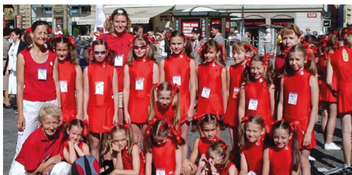
XI. všesokolský slet Praha 2006 - cvičenky skladby Sluníčka při sletovém průvodu.

Dne 31. prosince 1990 ukončil svoji činnost odbor ZRTV TJ ZVZ Milevsko a dne 1. ledna 1991 obnovila svoji činnost T. J. Sokol Milevsko. K ČOS se přihlásil celý odbor ZRTV, čímž vzrostl celkový počet členů nové jednoty na 384 (190 dospělí, 15 dorost a 179 žactvo). Tímto krokem se nová jednotka vyhnula (aniž to tehdy tušila) mnoha problémům s navrácením sokolského majetku, získáváním cvičitelů, cvičenců či činovníků. Přechod odboru ZRTV k ČOS proběhl opravdu klidně. Aktivní odbor ZRTV dokázal plně využít kapacitu milevské sokolovny - a tak nebránilo nic přechodu všech členů do obnovené T. J. Sokol, a nebyl problém ani s převodem majetku. Cvičební hodiny i veškerá další činnost Sokola plynule navázala na činnost odboru ZRTV.