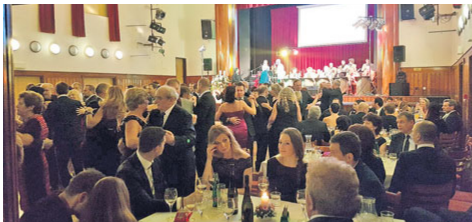
V pátek 16. února se v milevském domě kultury konal již třetí Ples města Milevska. K tanci a poslechu hrála tábořská kapela Swing Band, hostem večera byl zpěvák Jakub Smolík, nechybělo ani slosování o ceny.

Vážení čtenáři, díky dobré práci zaměstnankyň finančního oddělení úřadu již máme k dispozici výsledky hospodaření města v minulém roce. Jsem rád, že Vás mohu informovat o tom, že i rok 2017 byl pro město Milevsko ekonomicky úspěšný. Příjmy města za rok 2017 dosáhly výše 189,1 mil. Kč, výdaje 182,4 mil. Kč. Celkový kladný přebytek tedy činí 6,7 mil. Kč. Zůstatek peněz na účtech města se postupně zvyšuje, k 31. 12. 2017 to bylo 42,11 mil. Kč, což je o 22 mil. více než v roce 2014. Zdárně tím plníme slib, který