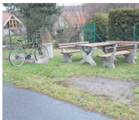
Nový mobiliář v Jickovicích.

Svazek obcí Milevska realizoval v minulém roce v rámci Programu obnovy venkova další společný projekt „Vybavení obcí mobiliářem, nákup