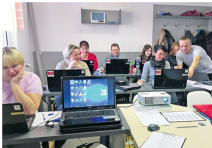
Ve spolupráci s agenturou Attavena o. p. s. se ženy (maminky po/na MD/RD) opět mohou od února do června 2018 v Centrum Milísek důkladně připravovat na návrat na trh práce.