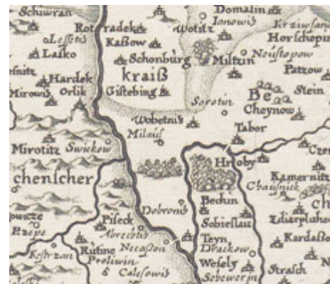
Mapa Českého království, vydaná Merianem roku 1650. Pod označením MILAUS zde nalezneme Milevsko.