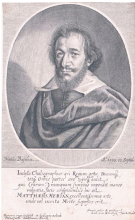
Matthäus Merian starší, (1593-1650)

Počátkem letošního roku byla kartografická sbírka Milevského muzea rozšířena o zajímavou mapu. V záhlaví je umístěn nápis Topographia Bohemiae, Moraviae et Silesiae , tedy Čechy, Morava a Slezsko. Mapa byla vydána roku 1650 ve Frankfurtu nad Mohanem a je dílem tehdy slavné mědiryteccké dílny rodiny Merianů, která právě ve Frankfurtu působila. Historických map Českého království existuje celá řada, ale nás zajímají především takové, na kterých je zachyceno i Milevsko. A protože na Merianově mapě skutečně vedle Tábora a Písku objevíme slovo MILAUS, jak bývá na starých mapách Milevsko často nazýváno, octla se právě z tohoto důvodu tato mapa ve sbírkách Milevského muzea.