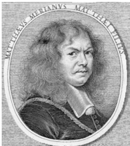
Matthäus Merian mladší (1621-1687)

Za jedno z Merianových životních děl bývá pokládána sbírka grafik evropských měst Topographia Germaniae . Tento soubor začal vycházet ve Frankfurtu roku 1640, ale byl dokončen až dávno po Merianově smrti roku 1688. Jedná se