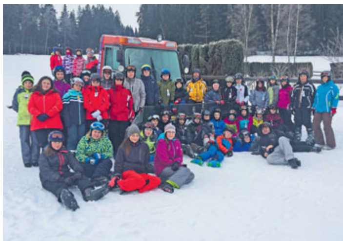
Žáci 7. ročníku 1. ZŠ T. G. Masaryka na lyžařském výcvikovém kurzu v Horní Vltavici na Šumavě, který se uskutečnil od 10. do 16. února.