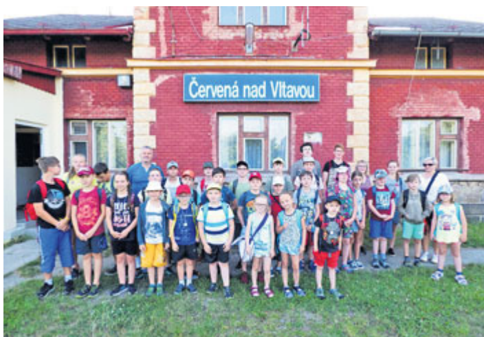
Prázdninování s Neználkem - 4. den - náročný výlet po zeleninovém okolí města Zelení s trochu nepěknými legráckami nedůvěřivých malenek.