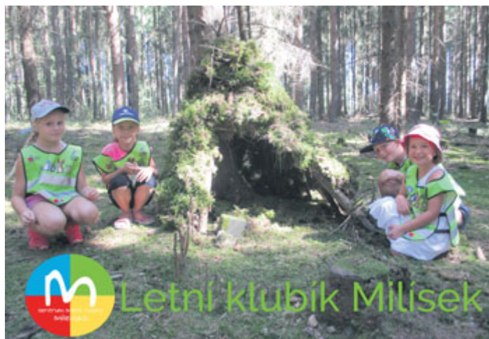
V týdnu od 6. do 10. srpna se uskutečnil v Centru Milisek druhý z letních klubíků pro děti, který probíhal ve stylu příměstského tábora. Dětem se společně strávený týden v klubíku velmi líbil. Na fotografii je část dětí při stavění domečku pro lesní skřítky.