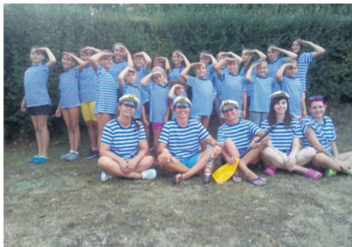
Letošní letní soustředění oddílu moderní gymnastiky a sportovní všestrannosti při T. J. Sokol Milevsko se neslo v námořnickém duchu. Dvoufázové tréninky přerušil v polovině týdne celodenní výlet, při kterém gymnastky vyměnily náčiní a nářadí za pádla a splouvaly Vltavu na raftech. Soustředění absolvovalo 20 gymnastek tradičně v prvním srpnovém týdnu ve sportovním areálu Sokola Křemže.