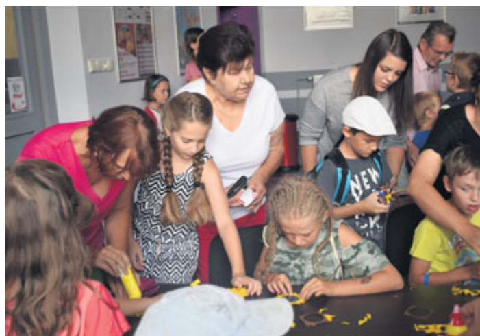
Téměř 80 zájemců si nenechalo v Milevském kině ujít prázdninovou dílničku spojenou s promítáním pohádky Pat a Mat znovu v akci.