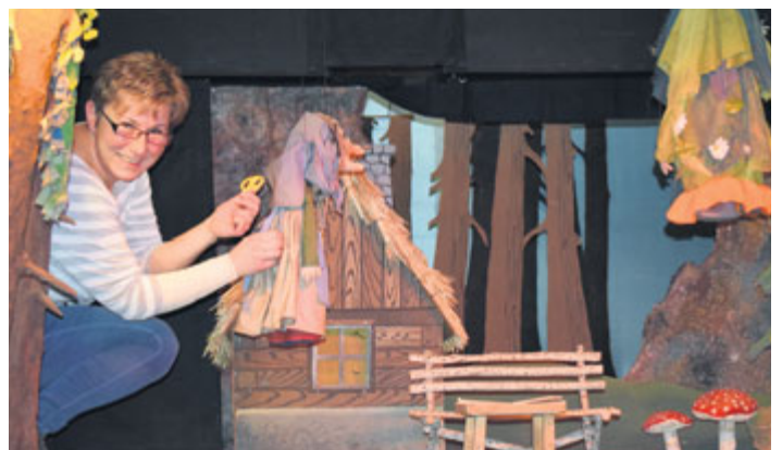
Milevští loutkaři, kteří se scházejí každý čtvrtek v domě kultury, v těchto dnech již pilně docvičují pohádku, kterou pro všechny děti připravují na neděli 2. února. Jmenuje se Trable s princeznou a můžete se těšit hned na dvě vystoupení za sebou.