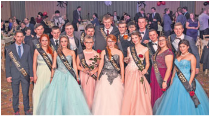
Maturitní a absolventský ples SOŠ a SOU Milevsko se povedl na výbornou. Přejme žákům podobné skóre i u zkoušek!