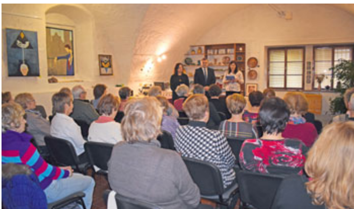
V úterý 21. ledna převzali všichni studenti Virtuální univerzity třetího věku při Městské knihovně v Milevsku z rukou pana starosty Osvědčení o absolutoriu a Pamětní listy za úspěšné splnění kurzů VU3V při České zemědělské univerzitě v Praze.