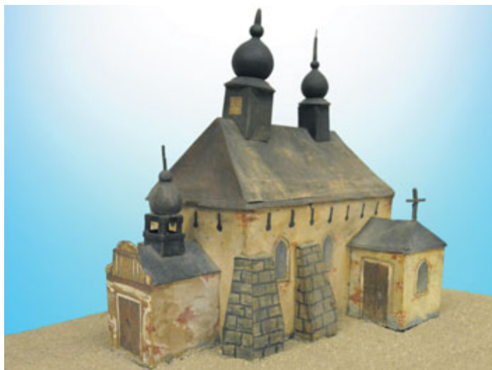
Papírový model bývalého renesančního kostelíka sv. Bartoloměje v Milevsku, zbouraného roku 1863.