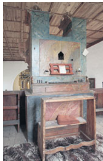
Pohled na zadní část Semrádových varhan v dobronickém kostele.