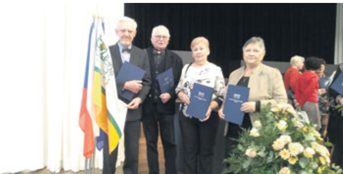
Ve středu 15. ledna se v aule Zemědělské univerzity v Praze zúčastnili Promoce zimního semestru studenti, kteří absolvovali kurzy Virtuální univerzity třetího věku při Městské knihovně v Milevsku. Od 4. února zahájíme letní semestr, tentokrát si senioři vybrali téma: Leonardo da Vinci a Křesťanská ikonografie a hagiografie.