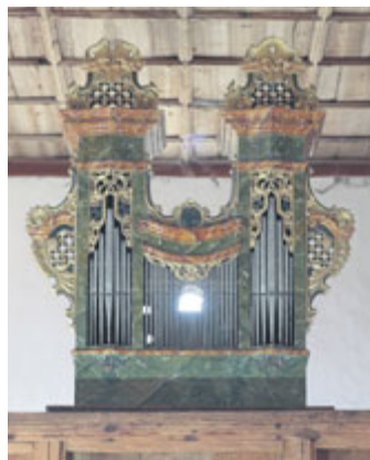
Semrádovy varhany z bartolomějského kostelíka v Milevsku, dnes umístěné v kostele Nanebevzetí Panny Marie v Dobronicích. Foto Martina Pelicha z jeho připravované monografie o kostele sv. Bartoloměje v Milevsku.