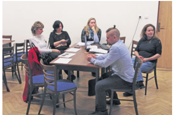
Pracovní skupina města.

které město zorganizovalo pro širokou veřejnost v pondělí 13. ledna od 17 hodin v prostorách Domu kultury v Milevsku.