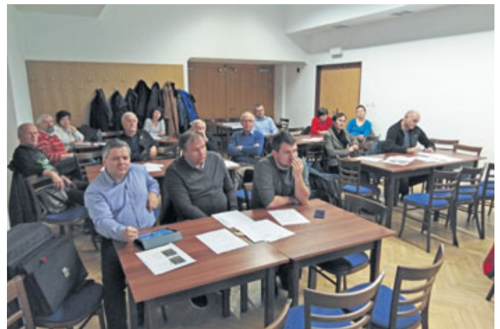
Občané, kteří přišli diskutovat své návrhy.