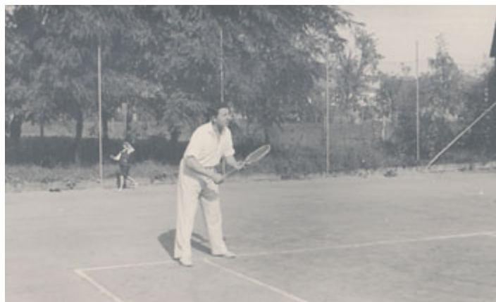
Při tenisovém zápase v Milevsku