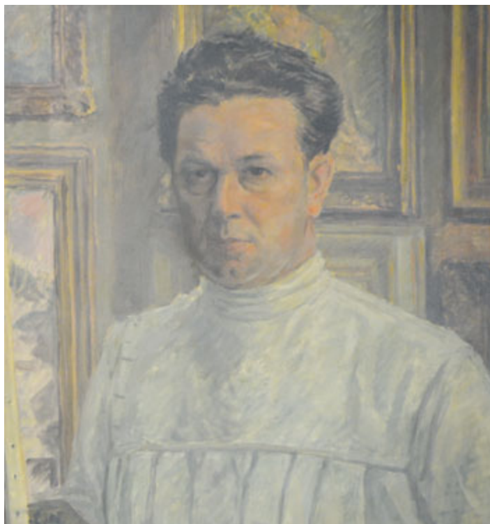
Autoportrét Josefa Fučíka