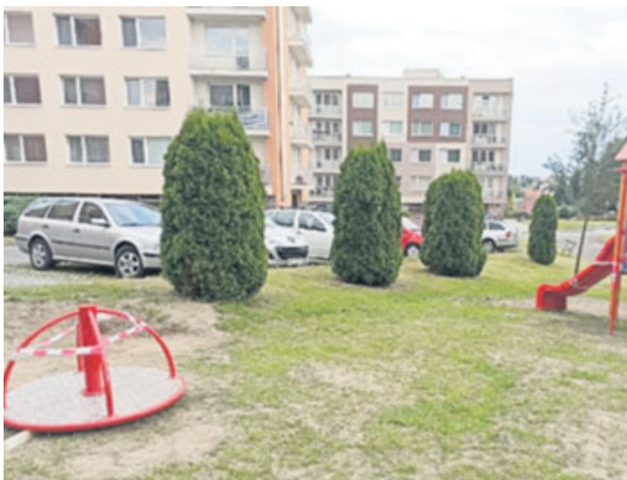
Během července vyrostlo několik herních prvků v lokalitě bytových domů ulice 5. května.