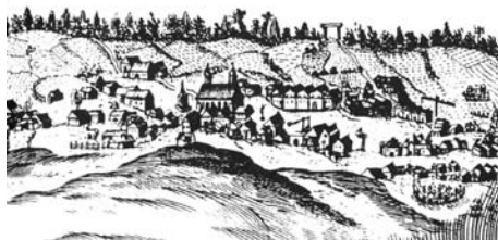
Milevsko - Veduta Marka Müllera z roku 1721. Na obzoru v pozadí je zachycena dřevěná šibenice na dvou sloupech.

1721 je vyobrazena dřevěná šibenice na obzoru v místě vyvýšeného pohorku mezi stromy. Skládá se ze dvou sloupů propojených vodorovným břevnem (Obr. 1). V pozvolné kotlině severně od Šibenného vrchu leží pole zvané „Na stínadlech“, kde se konaly popravy mečem. Dříve se uprostřed tohoto pole údajně nacházel kámen kruhového tvaru, na němž měl být vytesán kruh opatřený stružkou. Dle pověsti se mu říkalo „katův kámen“ a odsouzenci na něj měli