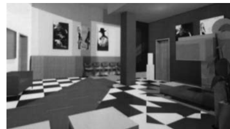
Kino - vizualizace interiéru zpracovaná Ing. Petrou Šmejkalovou

Návštěvnost kina Bios eM od roku 2007 po současnost zachycuje srovnávací tabulka. Dále je uveden výsledek hospodaření kina – příjmy a provozní výdaje. Investice v této tabulce zahrnuje nejspíše, ty již byly uvedeny v červnovém vydání Milevského zpravodaje. V předcho-