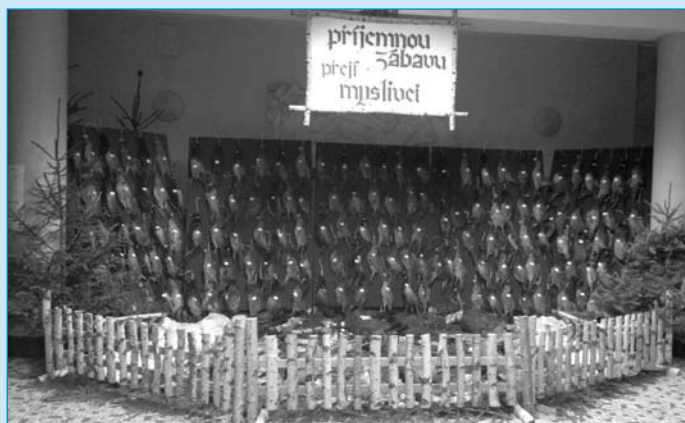
V sobotu 15. ledna se konal v Domě kultury Myslivecký ples, který zde již několik let pořádá Myslivecké sdružení Branice a který je známý svou bohatou zvěřinovou tombolou.