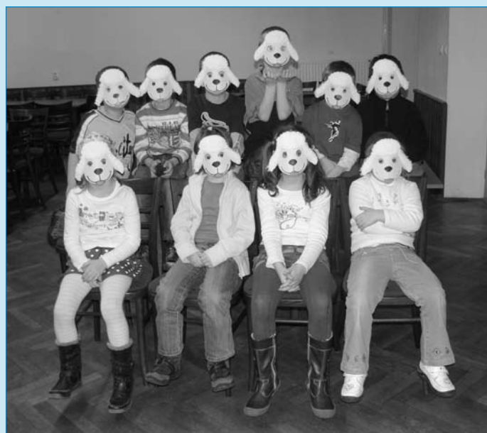
Na nadcházející sezonu karnevalů si vyrobily děti navštěvující kroužek Předškoláčky aneb hrajeme si na školu v Domě kultury karnevalovou masku ovečky.