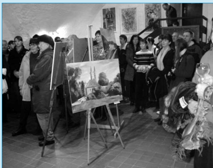
V pátek 14. ledna začal vernisáží již 22. ročník oblíbené výstavy Výtvarníci Milevska a okolí. Výstavu můžete zhlédnout až do 24. února v Galerii M.