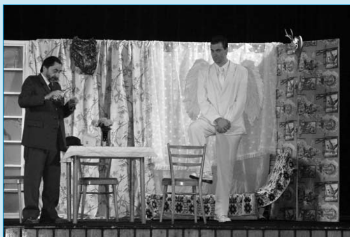
Postel pro anděla – tak se jmenovalo divadelní představení, které ve středu 19. ledna sehráli v milevském Domě kultury ochotníci z Písku. Na další ochotnické divadlo se můžete těšit 25. února, a to na komedii S tvój dcerou ne! v podání Ražického hravého spolku.