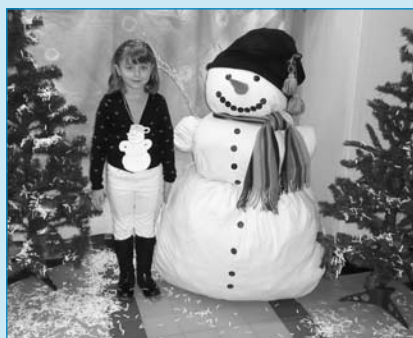
Základní školy v Milevsku připravily na pátek 21. a sobotu 22. ledna zápisy dětí do prvních tříd. Na první základní škole T. G. Masaryka probíhal zápis již tradičně na určité téma - letos na téma ZIMA. Hned na úvod děti dostaly malého sněhuláčka, kterému chyběli knoflíky a ty děti dostávaly po úspěšně splněných úkolech. Na tento zápis jistě v dětech i rodičích zůstane pěkná vzpomínka. Celkem se zde přihlásilo 65 dětí, z toho ale o odklad školní docházky bude žádat 14 rodičů. Na druhé ZŠ J. A. Komenského se k zápisu dostavilo 48 dětí, o odkladu uvažuje 15 rodičů. Na obou školách se budou otevírat 2 třídy.