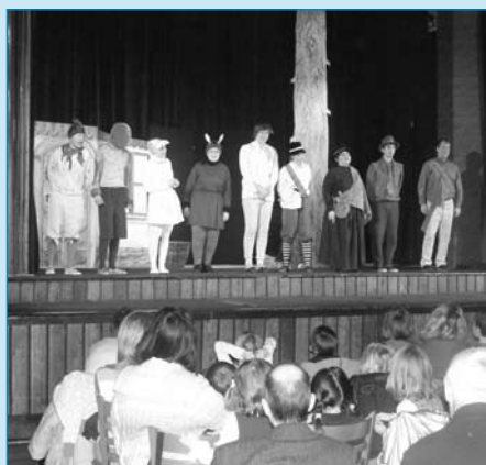
Pohádku Zvířátka a Petrovští v podání Divadelního souboru Tábor si nenechalo v neděli 23. ledna ujít téměř 100 návštěvníků Domu kultury.