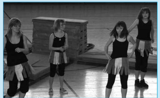
Malé ohlédnutí za Sokolskou akademií...