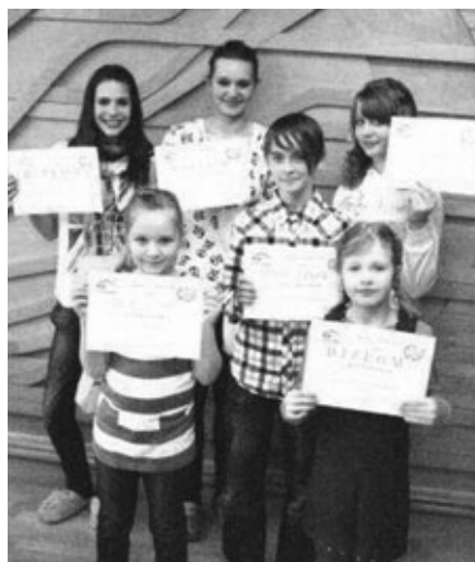
Na fotografii zleva: