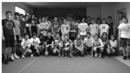
Na snímku jsou všichni závodníci

Ve středu 14. března se v DDM Milevsko uskutečnil jubilejní 20. ročník soutěže v silovém víceboji „O nejsilnějšího žáka milevských škol“. Zúčastnilo se 42 závodníků, žáků z obou milevských ZŠ, ZŠ Sepekova a ZŠ Bernartice. V soutěži družstev ve III. kategorii (6. - 7. tř. ZŠ) obsadilo 1. místo družstvo 2. ZŠ J. A. K. Milevsko s celkovým ziskem 473,05 bodů, 2. místo vybojovalo družstvo ZŠ Bernartice a 3. místo družstvo ZŠ Sepekova. V kategorii IV. (8. - 9. tř.) 1. místo 2. ZŠ J. A. K.