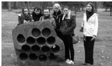
Zastávka na cestě do kláštera

Ve středu 14. března proběhl na Střední odborné škole a Středním odborném učilišti projektový den s názvem „Město, ve kterém chodím do školy, jeho zajímavosti, historie a současnost“,