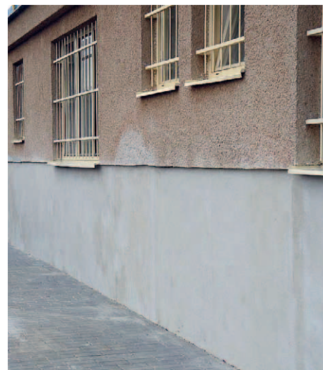
Stav východní části tribuny před a po odizolování.