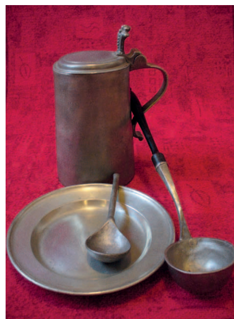
Cínové barokní nádobí ze sbírek Milevského muzea. Konvice nese datum 1690, takže pochází právě z časů Jiřího Evermoda Košetického.