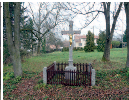
Kříž v Něžovicích.

Mohl byste nám závěrem říci, co chystáte pro rok 2014?