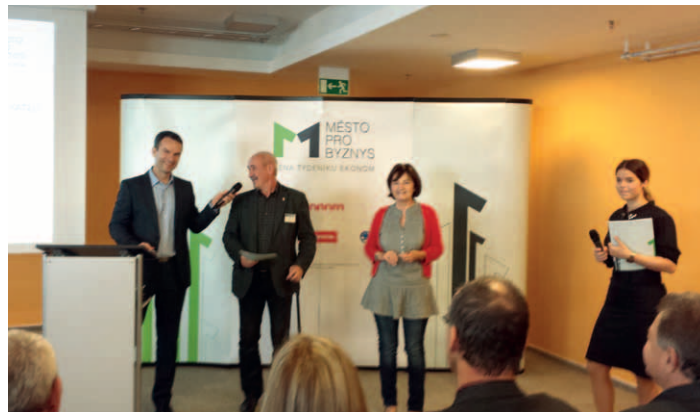
Starosta města Bc. Zdeněk Herout při přebírání ocenění.

Starosta města Bc. Zdeněk Herout děkuje všem živnostníkům a podnikatelům za účast ve srovnávacím výzkumu, tajemníkovi a všem zaměstnancům Městského úřadu Milevsko za dosažené výsledky v rámci tohoto výzkumu. Velmi si vážíme tohoto ocenění, je to pro nás povzbuzení a výzva do další spolupráce s Hospodářskou komorou a podnikateli v našem regionu.