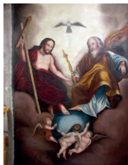
Opravený obraz z kaple Nejsvětější Trojice v Klisíně.