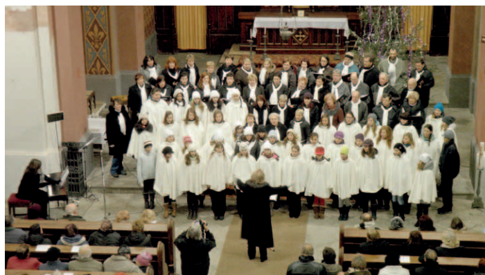
Milevský smíšený sbor spolu s Milevským dětským sborem v roce 2012 při Vánočním koncertu v kostele sv. Bartoloměje v Milevsku.