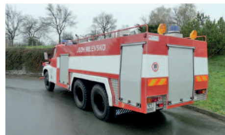
Požární vozidlo CAS 32 - T 148 před a po opravě a modernizaci.

Jednotka Sboru dobrovolných hasičů v Milevsku používá ke svým zásahům dvě speciální požární vozidla. Požární vozidlo CAS 24 - LIAZ 101 darované v červnu 2011 městu Milevsku Hasičským záchranným sborem Jihočeského kraje a požární vozidlo CAS 32 - T 148.