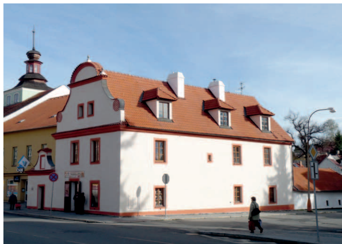
Opravená fasáda fary.

Ano, v této kapitole bývá alokováno okolo 150.000 Kč. V roce 2013 se podařilo z grantu Jihočeského kraje a za přispění ČEZu tuto částku navýšit