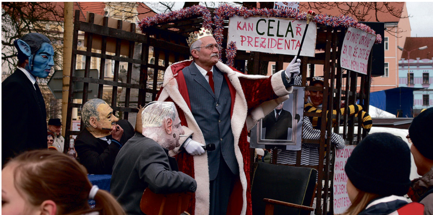
Milevské maškary 2013 jsou již minulostí. V sobotu 9. února zavítali do Milevska i představitelé státní politické scény v čele s odstupujícím prezidentem Václavem Klausem.