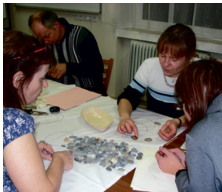
Originální drátěné šperky pod vedením manželů Pichových vznikaly ve čtvrtek 14. února na kurzu v DK Milevsko. Dalšími kurzy, na které se můžete těšit, budou Drátovaná vajíčka a Velikonoční vazba z živých květin.