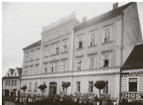
Stará škola, budova nynějšího gymnázia (30. léta 20. století).