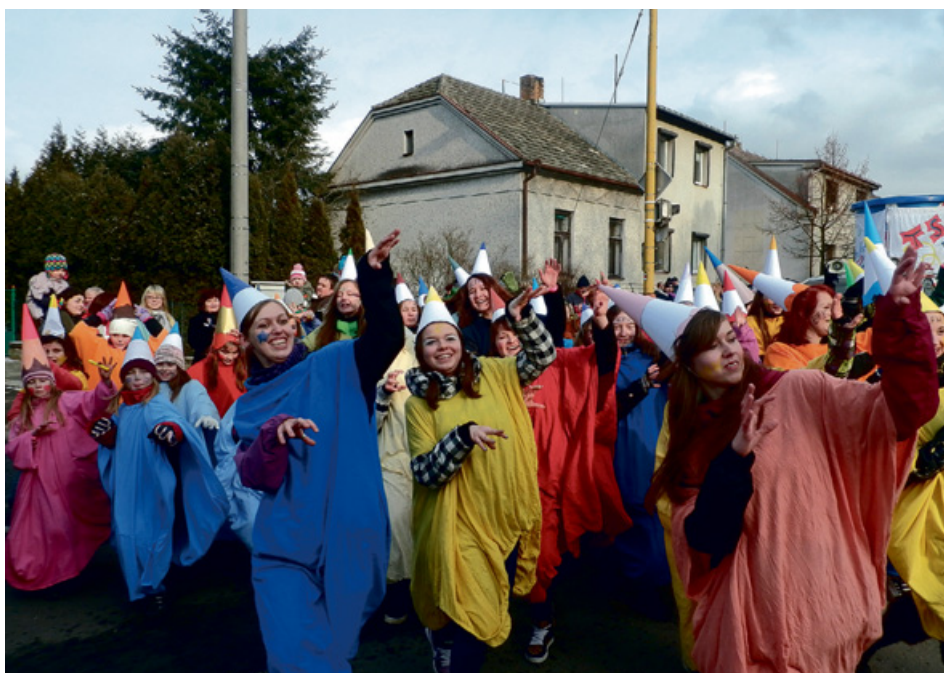
Taneční skupina EFK se průvodu zúčastnila poprvé, ale velmi úspěšně. Za rok plánují další vylepšení už tak nápaditých kreací.