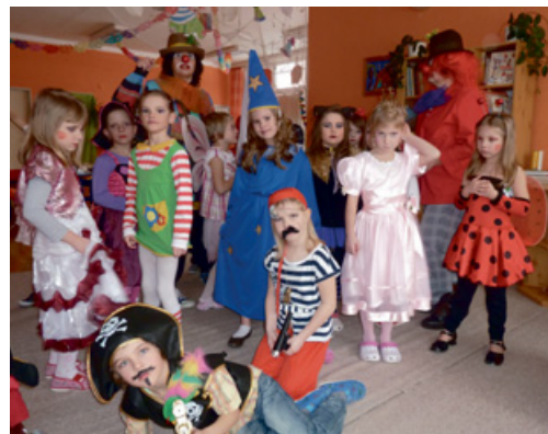
Karneval v Klubičku... Přehlídka masek, hudba a taneční rej a hlavně hodně legrace a zábavy – tak vypadal tradiční karneval v Mateřské škole Klubičko.