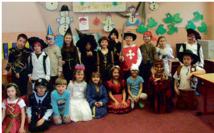
Karneval na 1. ZŠ. Ve čtvrtek 14. 2. a v pátek 15. 2. si děti prvních a druhých ročníků na 1. ZŠ Milevsko užily karnevalové zábavy. Kromě zábavných disciplín řešily i zajímavé úlohy z českého jazyka a matematiky. Na závěr karnevalového reje děti získaly sladkou odměnu, 2. B velký dort.