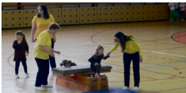
Ve čtvrtek 21. února se konala Sokolská akademie, na fotografiích jsou jedni z nejmladších milevských cvičenců.