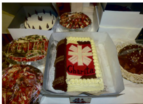
Tombola se skládala z 375 cen.

Peníze budou použity na dofinancování provozu terénní pečovatelské služby, kterou naše charita provozuje.