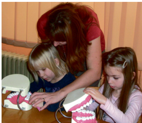
Veselé zoubky. Ve středu 13. 2. navštívily prvňáčky na 1. ZŠ Milevsko pracovnice DM drogerie. Zábavným způsobem ukázaly dětem, jak si čistit zoubky. Na závěr děti dostaly taštičku s potřebami ústní hygieny.