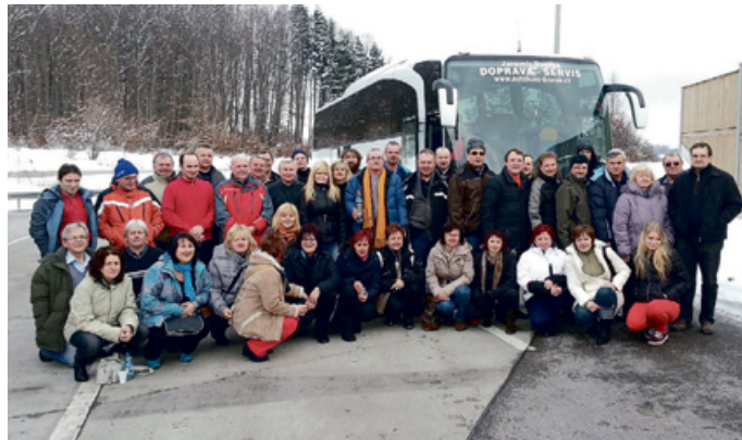
Členové výpravy při zastávce na cestě poblíž Mnichova.