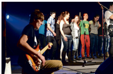
Na Festivalu vystoupil také školní sbor SOŠ a SOU Milevsko.

Originální nápad uskutečnila ve čtvrtek 31. ledna SOŠ a SOU Milevsko. Zorganizovala první ročník hudebně zábavné akce Festival na kopci. Cestu do domu kultury našlo nakonec více jak čtyři sta spokojených návštěvníků. Nabížený program byl složen z vystoupení rockových skupin, mladých zpěváků z projektu Oběžná dráha, místních tanečních skupin a gymnastického cvičení.