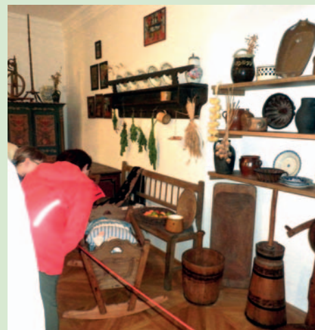
Pohled do „babiččiny světničky“.