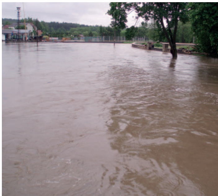
Božetice pod vodou...