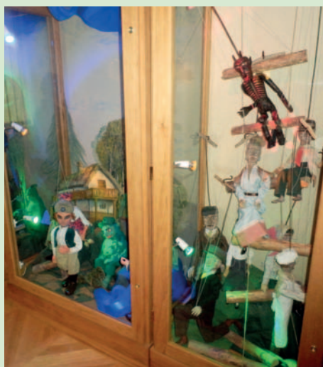
Pohled do expozice „loutkového salónku“.

kého skla, nerostů a drobných šperků, odborné literatury a pohlednic, je zde nabídka rozšířená také o repliky historických zbraní a nově i o chlazené nápoje, což návštěvníci v letním období jistě uvítají.