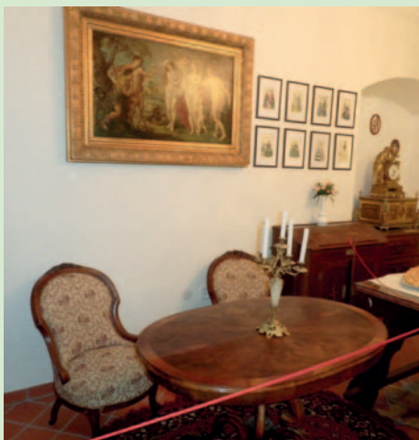
Salónek ve stylu tzv. druhého rokoka.

V přízemí muzea je pokladna a prodejna suvenýrů. Kromě tradičního zboží, replik historických