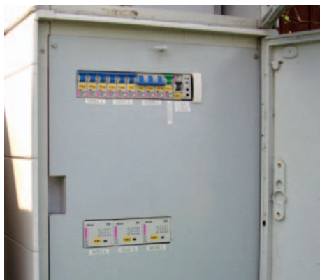
Pro porovnání foto zastaralého a moderního rozvaděče.