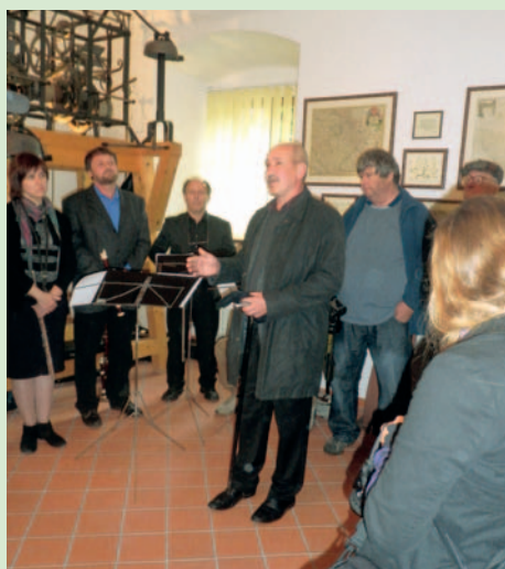
Starosta Zdeněk Herout během projevu při otevření nového muzea

Nová budova Milevského muzea na druhém klášterním nádvoří byla původně vystavěna v letech 1768–69 jako byty pro úředníky tehdejší správy klášterního panství. V 19. a 20. století zde byla lesní správa a v polovině minulého století budova sloužila jako byty. V letech 2011–2012 budova prošla generální opravou a nyní zde sídlí Milevské muzeum.