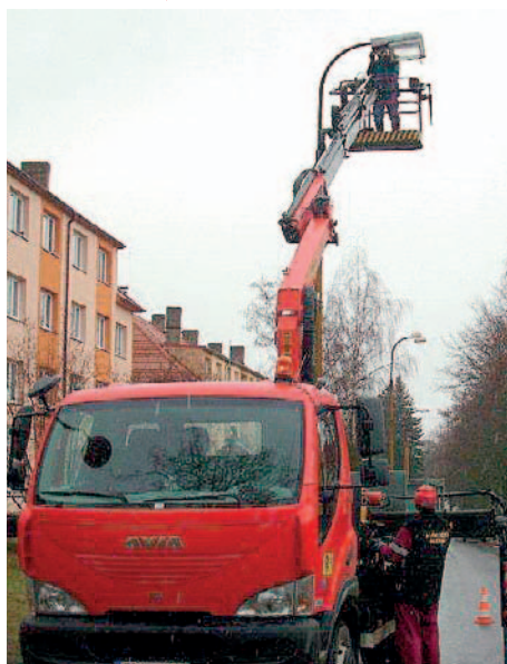
Pracovníci Služeb Města Milevska při instalaci nového osvětlení.