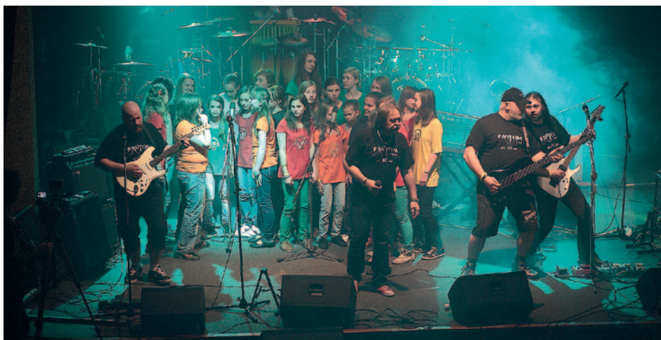
Kapela Fantom a Milevský dětský sbor společně při oslavách 40. výročí založení kapely.