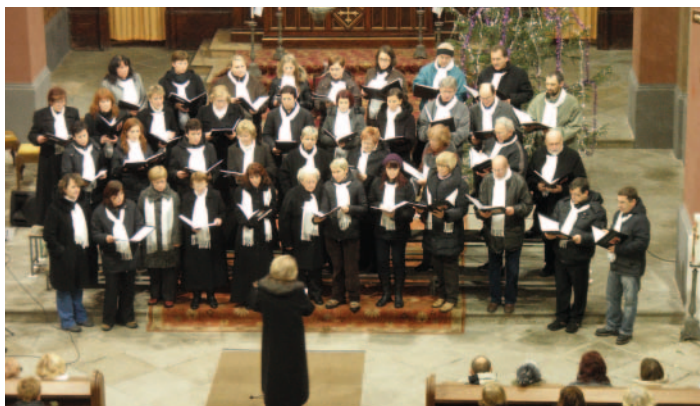
Milevský smíšený sbor jako tradičně, tak i letos, uskuteční 23. 12. 2014 Vánoční koncert v kostele sv. Bartoloměje v Milevsku.