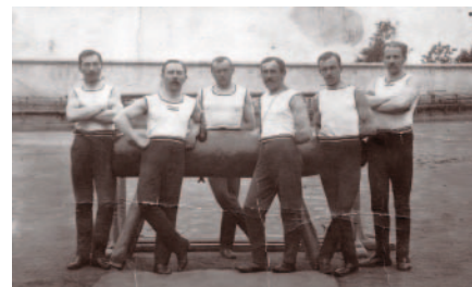
U koně - 1920

tělovýchovných organizací již 31. března 1948 . Průběh XI. všesokolského sletu, hlavně pak sletových průvodů Prahou, kdy začala perzekuce sokolských cvičitelů a činovníků, ukázal na další vývoj v tělovýchově. I v Milevsku bylo mnoho členů Sokola vyloučeno či