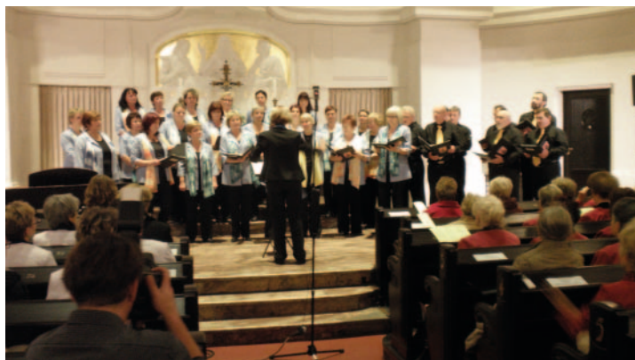
Milevský smíšený sbor se ve dnech 7.-8. 11. 2014 zúčastnil Mezinárodního setkání pěveckých sborů II. Cantate Dresden.