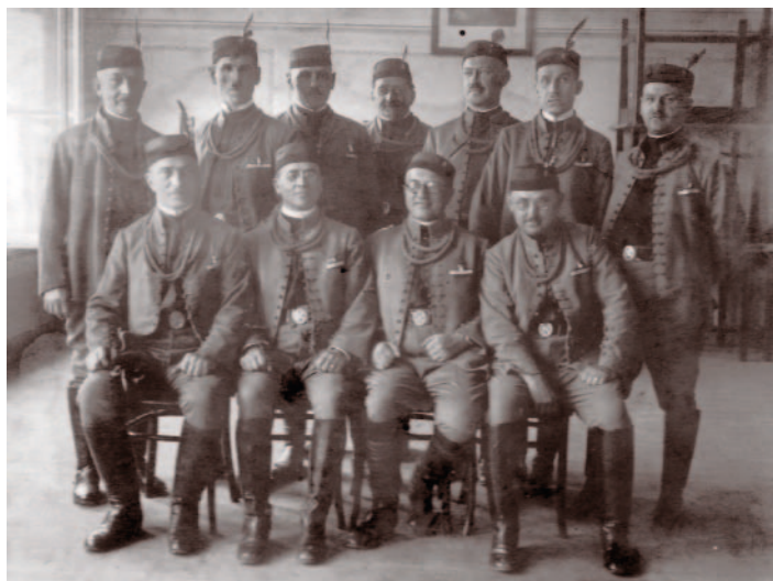
Bratři - 1920

Sokolové se nejprve pustili do stavby sokolského domku, který měl odlehčit provozu vlastní sokolovny. 16. listopadu 1923 byl položen základní kámen ke stavbě a již v červenci 1924 byla stavba sokolského domku za účinné podpory členstva i veřejnosti dokončena. V zimě 1924/1925 sokolové již cvičili ve svém, i když v malých místnostech.