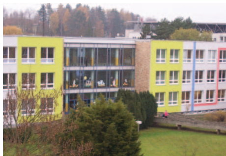
2. ZŠ Milevsko

Za přispění dotací z Operačního programu životní prostředí se v letošním roce v Milevsku uskutečnilo zateplení budov MŠ Sluníčko, MŠ Klubíčko a 2. ZŠ J. A. Komenského. Společným cílem těchto tří akcí bylo snížit energetickou náročnost budov.