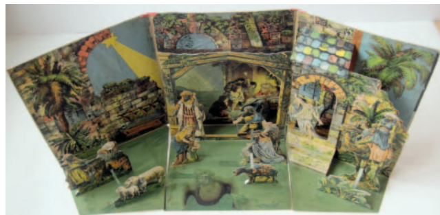
Německý betlém z majetku sester Blažkových po restaurování.

Vánoční betlém sester Blažkových ovšem není jedinou novinkou v Milevském muzeu. Loni si mohli návštěvníci vánoční výstavy poprvé prohlédnout velký keramický Milevský betlém, který pro naše muzeum zhotovil ateliér Radost manželů Pichových. Ten si návštěvníci muzea s sebou domů samozřejmě odnést nemohou, ale pracovníci muzea se