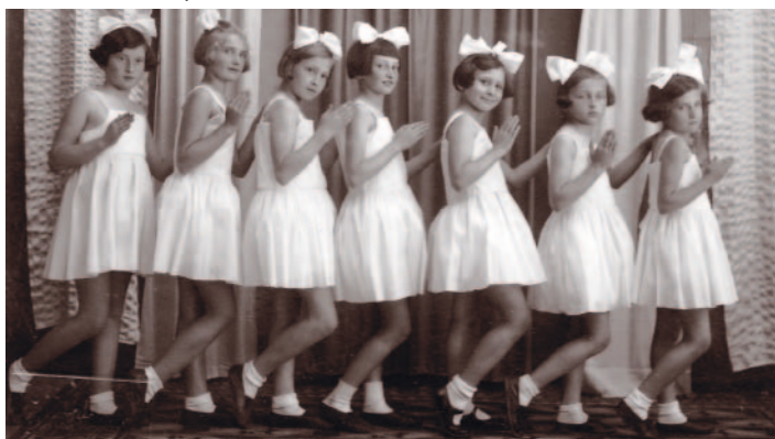
Žákyně - akademie 1933

vyakčneno, nesměli se věnovat tělovýchovné práci, někteří byli postaveni na majetku nebo i věznění. I přes tyto ztráty se našli další obětaví cvičitelé, kteří v práci s mládeží i s dospělými v nových nepříznivých podmínkách pokračovali. Svoji cvičitelskou práci postavili na sokolských základech, na sokolských zásadách, na sokolské náplni činnosti - poslání ani cíl se tak od sokolských příliš nelišily. Obrovská změna ale nastala v ideologii. Nastupující režim se snažil Sokol a sokolské ideály vymazat z myslí lidí. Ale ani za více než 40 let se mu to nepodařilo - vždyť jsme po celý ten čas všichni chodili do Sokola (možná jen do sokola) a cvičili jsme v sokolovně. Oficiální názvy jednoty se však zpočátku měnily.