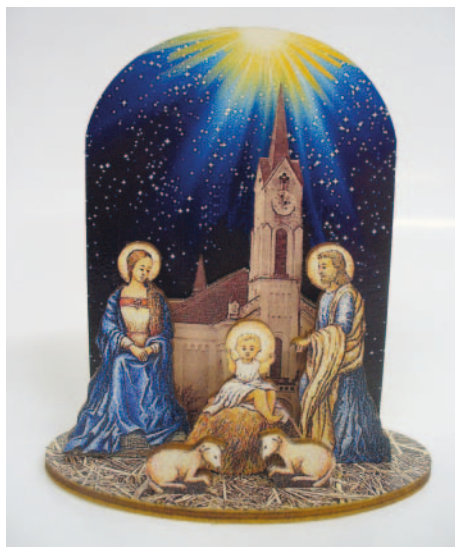
Milevský betlém s kostelem sv. Bartoloměje – tuto novinku pro vás připravili pracovníci Milevského muzea. Kde si ho můžete zakoupit se dozvíte v článku na straně 5.

Uzávěrka lednového čísla Milevského zpravodaje je ve středu 17. prosince 2014. Předem děkujeme za včasné zaslání příspěvků a upozorňujeme na změnu e-mailové adresy Milevského zpravodaje, která je: zpravodaj@milevskem.cz