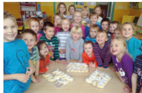
Ačkoliv Martin na bílém koni ani letos nepřijel, přesto jeho svátek děti z Mateřské školy Kytíčka v duchu tradic oslavily. Vyprávění, hry, básničky a písničky zpestřilo pečení svatomartinských rohlíčků.