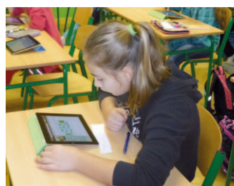
Ve dnech 12.-14. listopadu se 1. ZŠ Milevsko jako každý rok zapojila do soutěže Bobřík informatiky. Celkově se soutěže na naší škole zúčastnilo 206 žáků.