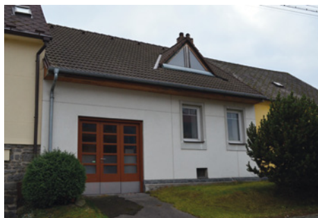
Dům čp. 307 v Sokolovské ulici nedaleko dřívějších jatek, stav v roce 2015.