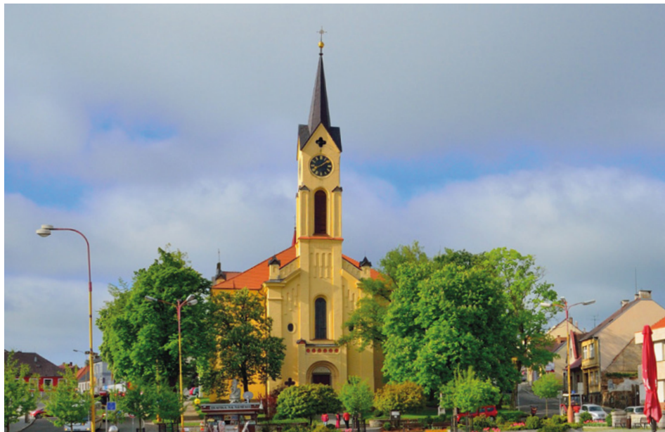
150 let milevského kostela sv. Bartoloměje. Více na straně 4.