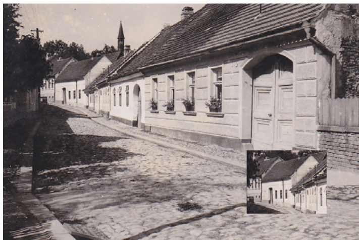
Růžová ulice, pohled od východu - její pravá strana směrem k náměstí ustoupila dnešnímu autobusovému nádraží. Dům čp. 242 ve výřezu vpravo dole, 1946.

V dnešní uspěchané době často chodíme ulicemi měst, aniž bychom vnímali stavby, které nás obklopují. Neznáme jejich osudy ani tvůrce. Ale přesto by někdy nebylo od věci připomenout si dílo těch, kteří už dávno nežijí, ale výsledky jejich práce nás obklopují dodnes.