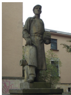
Pískovcová socha Práce u domu kultury v Milevsku, 1952.