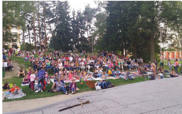
V úterý 18. července bylo promítání letního kina v amfiteátru domu kultury převážně pro dětské diváky, kteří si nenechali ujít film Lichožrouti. Po celý srpen bude promítání letního kina každé úterý od 20:30 hodin.