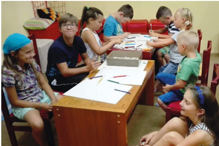
Každou červencovou středu se na dětském oddělení městské knihovny tvořilo. Foto je z oblázkování.