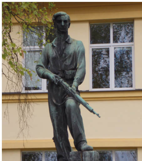
Bronzový pomník padlým II. světové války Barikádník v Bernarticích, 1945 - 1950.