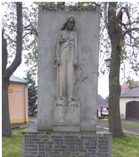
Pískovcový pomník padlým I. světové války v Radčicích u Bechyně, 1935.