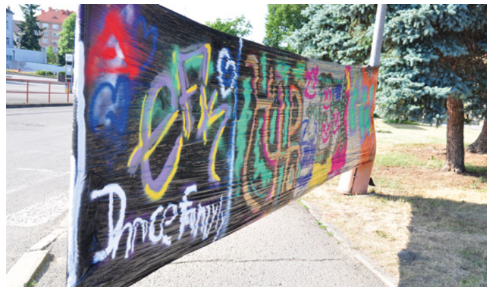
V rámci Slavnostního zakončení tanečního roku a oslav 10 let EFK dance family proběhl graffiti jam, na kterém si nejen tanečníci mohli vyzkoušet tvorbu se spreji na černé folii, a to před Kamenáč Music Art Pubem