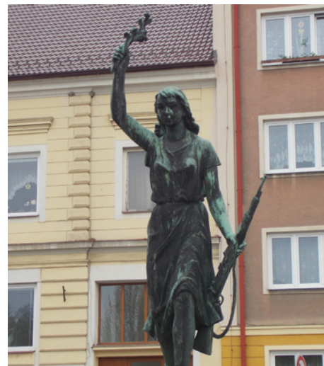
Bronzová socha Vítězství revoluce na náměstí Edvarda Beneše v Milevsku, 1950.