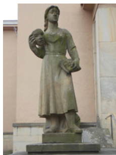
Pískovcová socha Kultury u domu kultury v Milevsku, 1952.