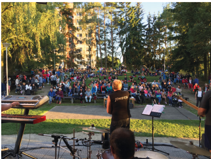
V rámci Milevského léta 2017 vystoupila v amfiteátru domu kultury ve čtvrtek 13. července také kapela Fantom.