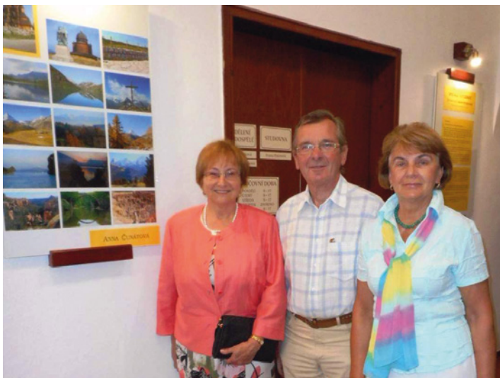
V pondělí 3. července proběhla v knihovně vernisáž výstavy fotek z kurzu Fotografování, který pořádal Senior klub ZVVZ. Výstava je otevřena ve vestibulu knihovny po celé léto kromě čtvrtků, a to od 8:00 do 17:00 hodin.