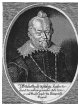
Vilém Slavata. Podle čupřiny vlasů se mu někdy přezdívalo Chocholouš.