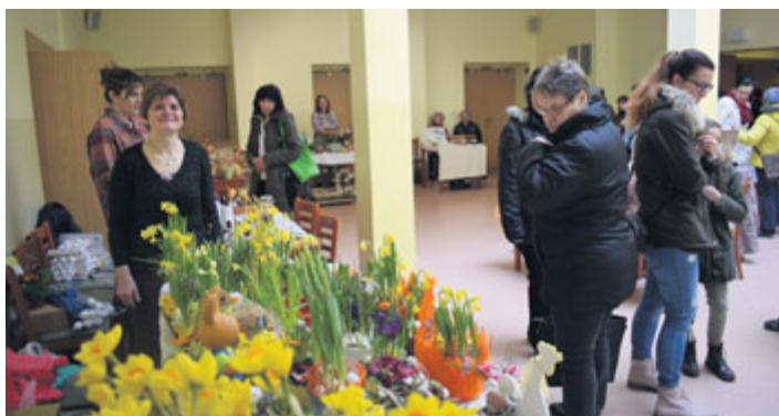
Koncem března se v DK Milevsko uskutečnily oblíbené Velikonoční trhy.