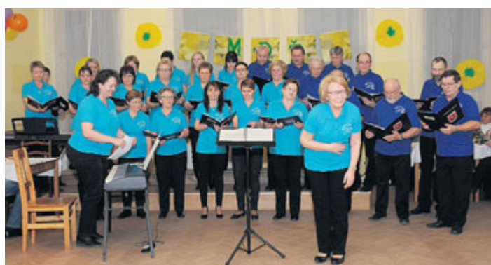
Milevský smíšený sbor zazpíval na oslavě MDŽ v Kostelci nad Vltavou.