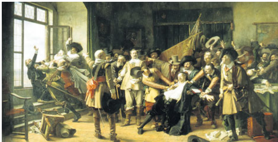
Pražská defenestrace roku 1618, olejomalba Václava Brožíka z roku 1889.

V letošním „osmičkovém“ roce si připomínáme celou řadu výročí našich dějin. Roky 1918, 1938, 1948 i 1968 byly důležitými milníky v historii státu, ale neměli bychom zapomínat i na některá další výročí, která se k letošnímu roku vážou. Jedním z nich je výročí počátku třicetileté války. Výsledek této války předurčil dějiny našeho státu na další tři století. Rozbuškou v sudu prachu byla pražská defenestrace císařských místodržících v květnu 1618. Oč se vlastně jednalo?