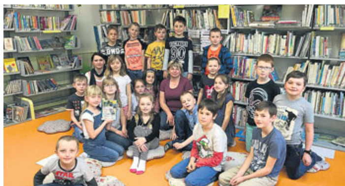
Městská knihovna má dvě lektorky, které se věnují podpoře čtenářství dětí a mládeže. Na pobočku knihovny v domě kultury za nimi v dubnu přišli také třetíci z 2. ZŠ.