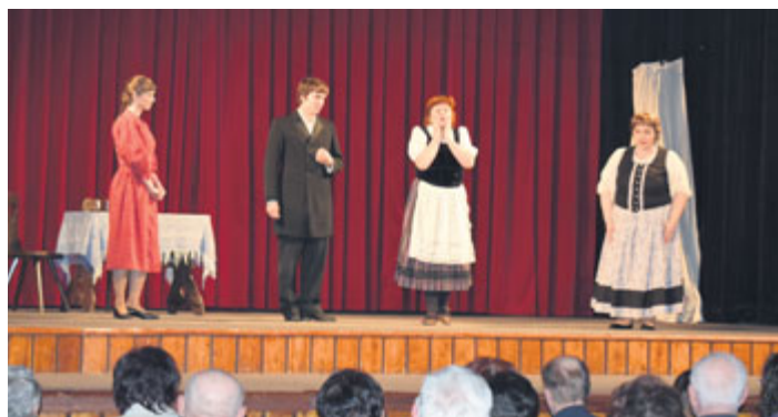
Divadelní soubor Tábora vystoupil v milevském domě kultury s představením Trdohlavá žena.