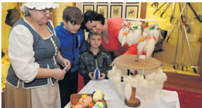
V neděli 25. března se konal 16. velikonoční jarmark v Milevském muzeu, přišlo přes 600 platících návštěvníků.