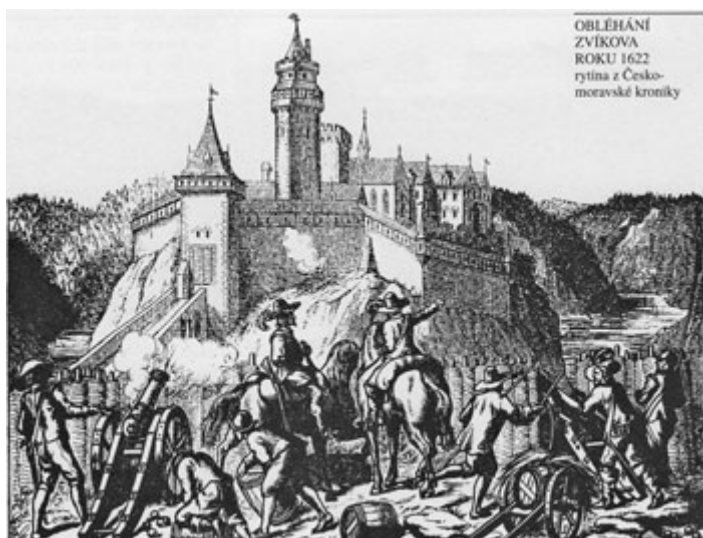
Dobývání Zvíkova roku 1622. Kresba z Českomoravské kroniky (1860).