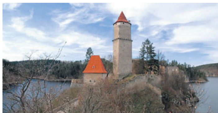
Dnešní pohled na Zvíkov z téhož místa.

Jakkoli se veřejnost domnívá, že třicetiletá válka už podle svého názvu trvala tři desítky let, není to tak zcela pravda. Pod označením „třicetiletá válka“ rozumíme několik válečných konfliktů, následujících těsně po sobě v rozmezí let 1618–48. První z nich byla v letech 1618–20 válka česká, pak následovala válka falcká v letech 1621–23, poté v letech 1625–29 válka dánská a roku 1630 vypukla válka švédská. Když se pak roku 1635 do konfliktu zapojila i Francie, říkalo se této poslední fázi bojů – švédsko-francouzská válka.