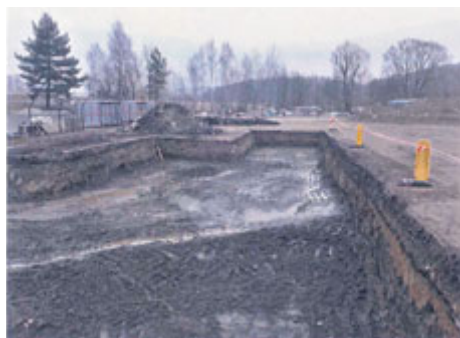
Výkop pod odvezeným sarkofágem.

Milevsko si může oddychnout; ekologická zátěž v areálu bývalé obalovny živých směsí (na hranici katastru Milevsko a Přeborova), léta strašící milevské občany, je odstraněna. Mnohaletá snaha o likvidaci nevhodného a především nebezpečného sarkofágu (vysoký obsah polychlorovaných bifenyly - PCB) i o odstranění podpovrchových vrstev kontaminovaných zemín se chýlí k úspěšnému konci. Když se v roce 2012 podařilo na Ministerstvu životního prostředí panu RNDr. Gruntorádovi vykřesat jiskřičku naděje, že se po dlouhém čase začne stát zajímat o místní nedořešený problém, bylo potřeba bezodkladně zareagovat. V závěru roku 2012 jsme spolu s přeborovskou starostkou paní Pištěkovou a s tehdejší starostou Milevsko panem Heroutem objížděli a oslovovali početnou skupinu vlastníků