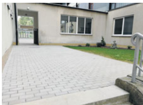
Dokončení ze strany 1

Další velkou pozitivní změnu pocítí samotní hokejisté. Při východu z chodby šaten na ledovou plochu byly nově osazeny automatické posuvné dveře na místo starých těžkých otevíraných. „To uvítají nejvíce naši nejmenší hokejisté, kteří se s kovovými dveřmi museli doslova poprat, než je překonali. Dveře dodala společnost TRIDO v závěru července. Na financování dveří jsme se dohodli s vlastníkem budovy, fir-