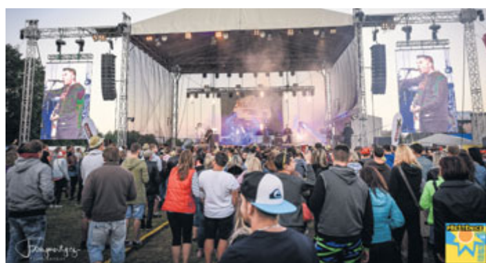
Závěr školního roku patřil festivalu v Přeštěnicích. Tento ročník opět nabídl širokou škálu hudebních žánrů pro všechny generace. Vystoupily mimo jiné skupiny No name, Rybičky 48, Inekafe, Trautenberk, zpěváci Marek Ztracený, Ben Cristovao, Ivan Mládek, pro děti bylo připraveno zábavné odpoledne se skupinou Čiperkové.