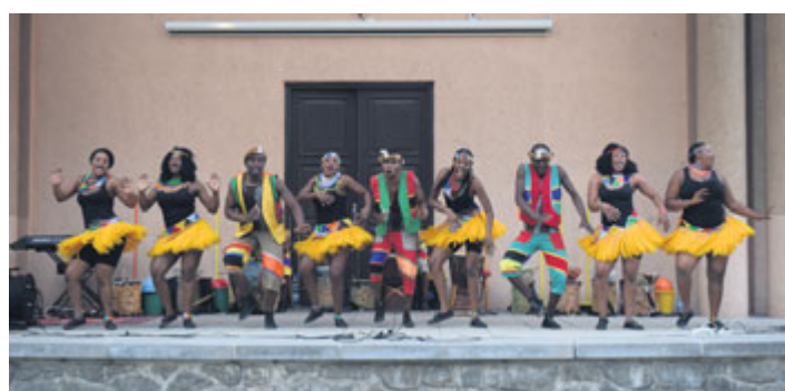
Ve středu 18. července vystoupila v amfiteátru DK Milevsko skupina afrických studentů Iyasa ze Zimbabwe. Návštěvou tohoto představení přišli lidé podpořit rozvoj umělecké školy v Bulawayu a vzdělání afrických dětí.