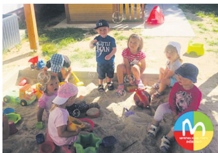
Děti z jesliček a mikrojeslí Milisek si společně užívají slunečního dopoledne na zahradě. Letní jesličky jsou celodenní zařízení péče o děti od 1 do 4 let, registrované jako dětská skupina s individuálním přístupem k dítěti. Otevřeny jsou po celé léto a frekvenci docházky si zvolíte, jak potřebujete.