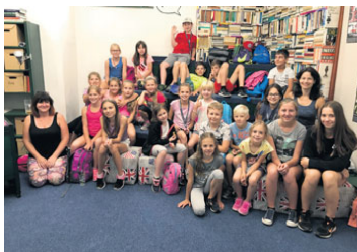
Letošním příměstským táborem milevské knihovny prošlo 42 dětí, které se proletěly jako tajní agenti literárním světem. Objevily různé literární žánry, osvojily si řadu detektivních dovedností, navštívily táborské nakladatelství Baobab a Laser-game a jako první vyzkoušely novou Únikovou hru knihovny.