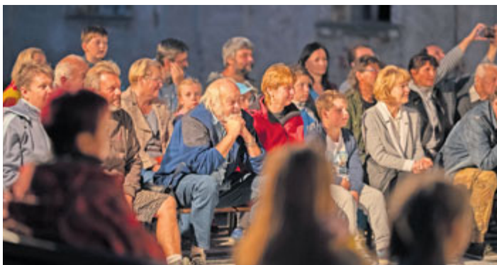
Noční představení Hudba, šerm a tance z časů renesance přilákalo v neděli 8. července do Milevského muzea 75 diváků, kteří zhlédli několik ukázek dobového šermu, renesančních tanců doprovázených hudebními skladbami starých mistrů a komentovanou módní přehlídkou.