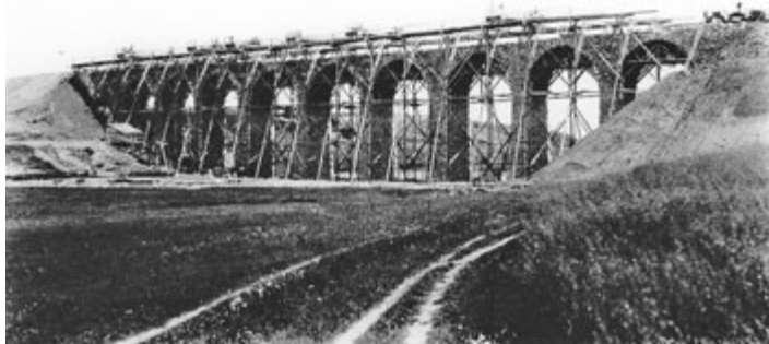
Stavba železničního viaduktu přes Milevský potok.