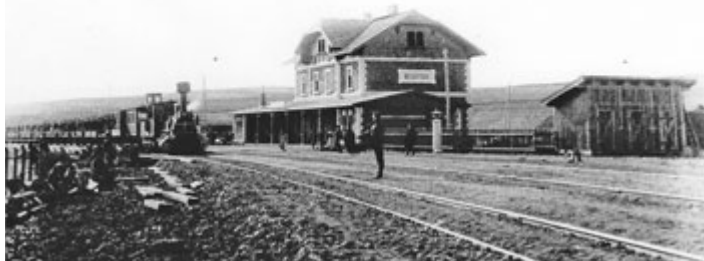
Příjezd prvního vlaku do Milevska.