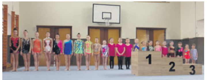
V sobotu 13. dubna uspořádal oddíl moderní gymnastiky v milevské sokolovně velikonoční minizávod. Dvaadvacet děvčat předvedlo své sólové sestavy divákům, kteří je po zásluze odměnili potleskem. Ten pro děvčata nebyl jedinou odměnou. Každá si odnesla velikonoční nadílku a všechny byly při závěrečném vyhlásování „odměněny“ pomlázkou.