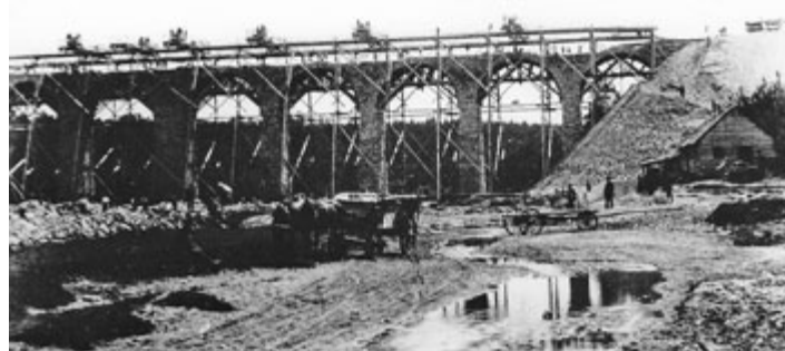
Stavba železničního viaduktu přes říčku Smutnou.