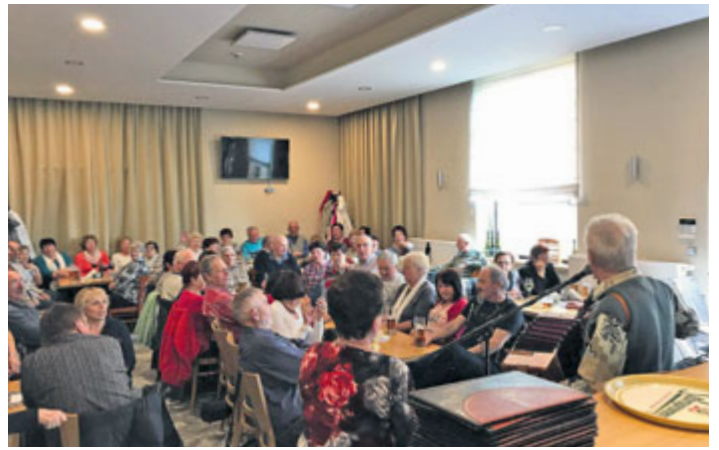
Zpíváme opět s kytarou a harmonikou - takový byl název oblíbeného hudebního podvečera, který již potřetí pořádal Senior klub ZVVZ ve spolupráci s DK Milevsko v úterý 2. dubna v Restauraci V Klubu.