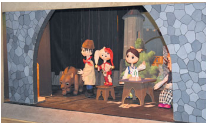
A na hradě nám straší - to byl název loutkové pohádky, kterou v neděli 31. března sehrál Loutkový soubor při DK Milevsko. Pro velký zájem byly odehrány dvě představení. V květnu se ještě chystá představení pro mateřské školy z Milevska a okolí.