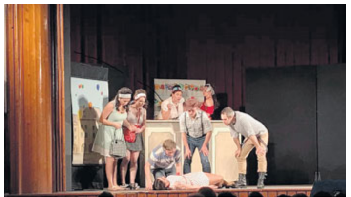
V neděli 7. dubna ve velkém sále DK představil spolek Kovářovská OPONA svůj retromuzikál s názvem To tenkrát v 68. na motivy filmu Filipa Renče Rebelové. Vystoupení bylo plné skvělých hereckých výkonů, známých písní a u diváků sklidilo veliký úspěch.