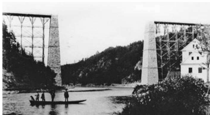
Stavba železničního mostu v Červené nad Vltavou foto z 30. 7. 1889.