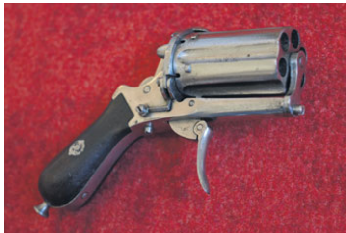
Belgická pepřenka Lefauchaux se sklopnou spouští. Byla to už zadovka na náboje ráže 7 mm, vyrobená kolem roku 1870. Ze sbírek Milevského muzea.