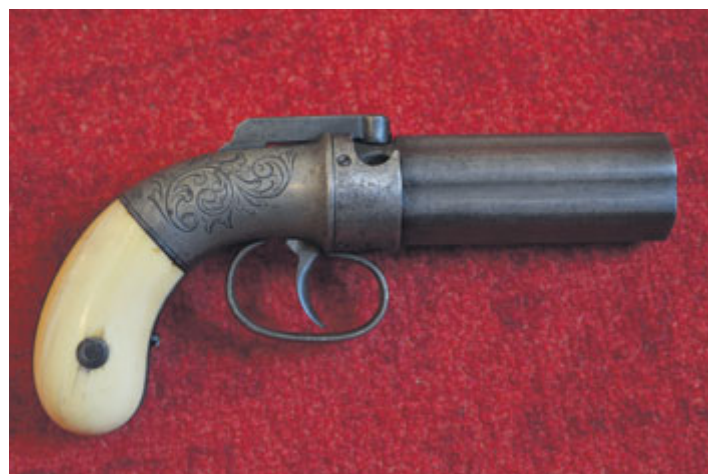
Pepřenka Allen, vyrobená v letech 1847–1854 v americkém Worcesteru. Ze sbírek Milevského muzea.