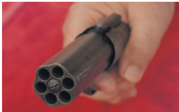
Pohled do ústí šestihlavňové pepřenky Allen.

Vladimír Šindelář