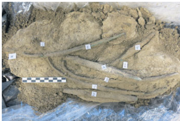
Fotografie části depotu žeber při preparaci v laboratoři Archeologického ústavu Filozofické fakulty Jihočeské univerzity.