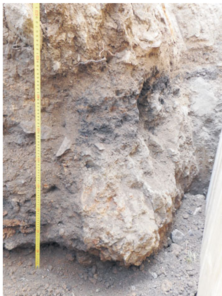
Zahloubený objekt, který snad sloužil k pálení vápna. Černá vrstva obsahovala keramické zlomky a uhlíky.

Rozsáhlejší akce probíhaly v Milevsku v souvislosti s rekonstrukcí elektrického vedení v ulicích Nádražní a Čs. legií, při kterém bylo dokumentováno velké množství keramických zlomků z novověku. Nálezy se kumulovaly před čp. 51 až 54 v ul. Československých legií, v těchto místech se nacházely dílny milevských hrnčírů. Tyto nálezy tedy můžeme spojit se strategiemi nakládání s odpadem milevských hrnčírů vrcholného novověku. V minulých letech byla v těchto místech prozkoumána jedna z odpadních jam, související s činností jednoho z posledních milevských hrnčírů. Od jara téměř do podzimu byl sledován prostor milevského hřbitova v souvislosti s budováním drenážního systému a opravou kanalizace. Zachyceno bylo několik struktur v různých částech hřbitova včetně zahloubeného objektu (obrázek vlevo), nacházejícího se těsně za hřbitovní zdí. Tento objekt můžeme na základě keramických zlomků datovat do 13. století, jeho funkci je možné spojit s pálením vápna. Můžeme tedy předpokládat, že fungoval v době výstavby premonstrátského kláštera. Na pálení vápna se též druhotně využívaly původně cihlářské pece, které se nacházely na opačné straně kláštera. Poslední větší akcí na katastru Milevska byla obnova hřiště u 1. ZŠ, při kterém, kromě recentních nálezů, byly zjištěny rybníční sedimenty potvrzující existenci rybníka, jež je však známý z map z 19. století (obrázek