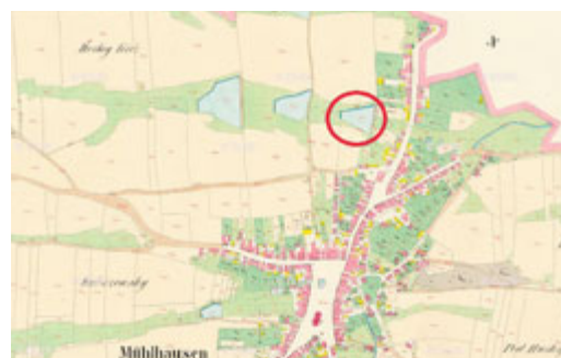
Výřez z Císařského povinného otisku map stabilního katastru Čech, z roku 1830 (zdroj: https://archivnimapy.cuzk.cz/ ).