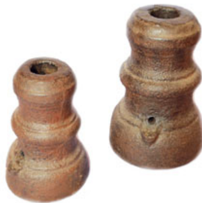
Litinové moždíře pro slavnostní salvy, 19. století. Ze sbírek Milevského muzea.

černého střelného prachu a pak se do hlavní pro zvýšení zvukového efektu zatloukl kulatý dubový špalík. To byl onen skutečný důvod hlasitého výstřelu. Další hrstička střelného prachu byla nasypána na malou místičku (pánvičku) na boku moždíře, odkud vedl úzký kanálek do hlavní. Když pak střelec pomocí hořícího doutnáku na dlouhé tyči zapálil prach na pánvičce, šlehl takto vzniklý plamen kanálkem do hlavní, kde pak zapálil vlastní prachovou náplň. Oslavnou střelbu z moždírů mohou televizní diváci spatřit i v jednom z dílů populárního seriálu F. L. Věk.