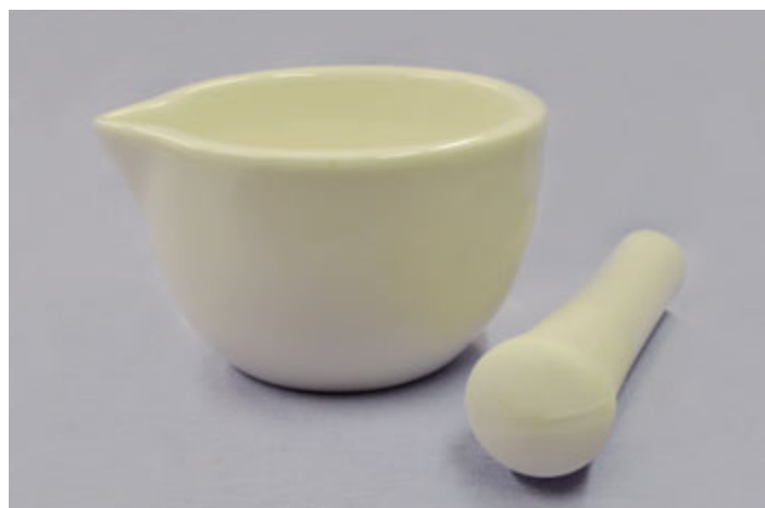
Soudobý porcelánový hmoždíř s kyjovitou paličkou. Soukromá sbírka.

Zatímco hmoždír je věc zcela civilní, v případě moždíře už je situace jiná. Moždír (německy: Mörser, anglicky: Mortar) je druh velkorážního děla s masivní krátkou hlavní. Moždíře nebyly umísťovány na kolovou lafetu, nýbrž kvůli velkému zpětnému rázu stály na bytelném dřevěném podstavci. Moždíře střílely horní skupinou úhlů, tedy nad 45°, takže střela dopadla na cíl téměř kolmo shora a obrana před ní byla dosti obtížná. Zatímco u běžných děl, střílejících dolní skupinou úhlů, bylo možno skrýt se třeba v okopu nebo za zdí, v případě moždírů to nepomohlo, protože střely z moždírů dopadly do zákopu shora a při následném výbuchu rozsávaly smrt a zranění. Už za třicetileté války totiž bývaly litinové granáty do moždírů často plněny střelným prachem. Ale ani kulové projektily bez prachové náplně nebyly o nic méně nebezpečné. Taková střela do moždíře vážila od 20 do 100 kg