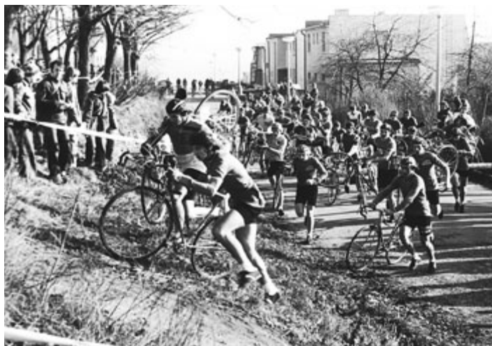
Cyklokrosaři těsně po startu vjíždějí do terénu na Hůrkách při 7. závodě Československého poháru a celostátní dorostenecké soutěže, 25. 11. 1978.