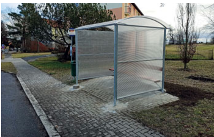
Nové autobusové zastávky byly instalovány v ulicích P. Bezruč a Sokolovská.