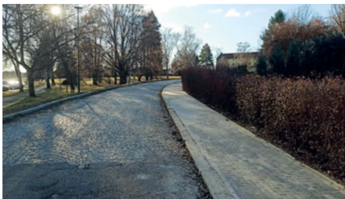
V Žižkově ulici byla úspěšně dokončena rekonstrukce chodníku.