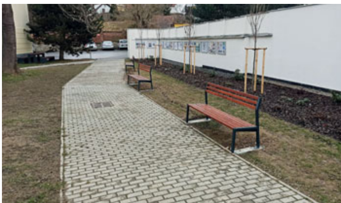
Možná už se někdo těší na jaro. Nové posezení v zrekonstruovaném prostoru za spořitelnu určitě potěší.