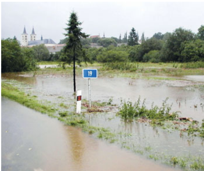
Pohled na milevský klášter od jihovýchodu.