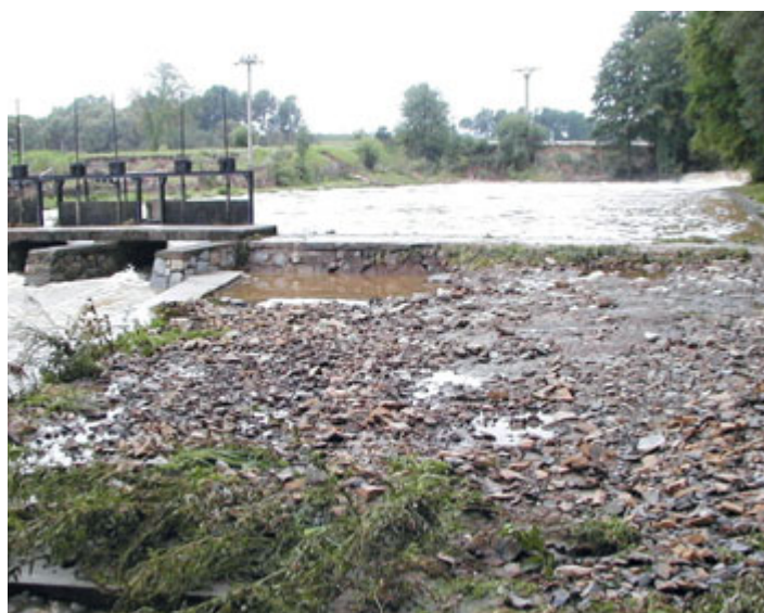
Bývalé koupaliště Na Vinicích po opadnutí vody.