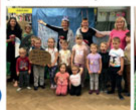
Letošní novinka - divadlo pro předškoláky v rámci projektu Knihožrouti.