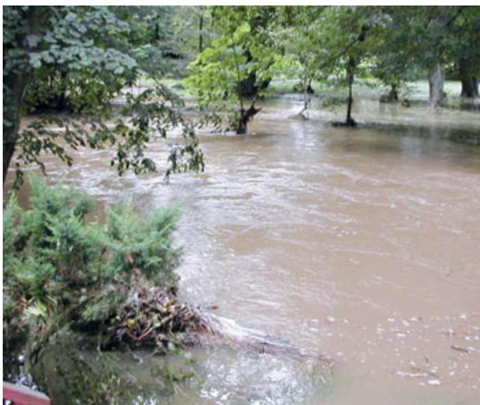
Park Bažantnice, u klášterního mostu.