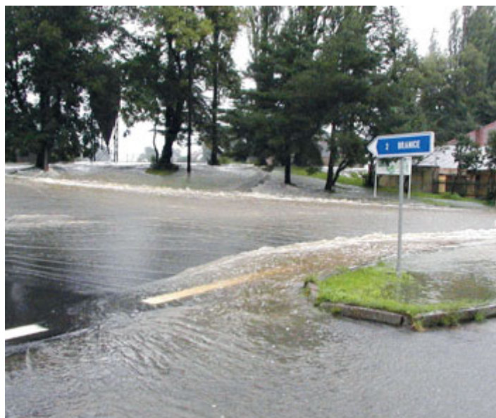
Veselíčko – střed obce.