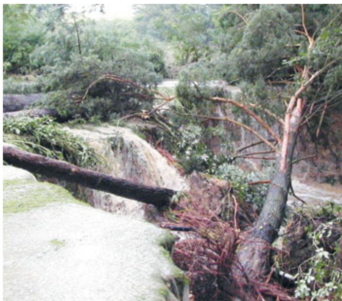
Sepekov, hráz rybníku Chobot.