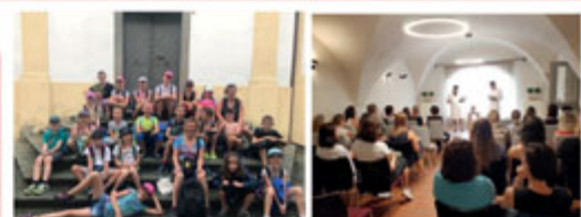
60 dětí letos absolvovalo naše knihovnické příměstské tábory.