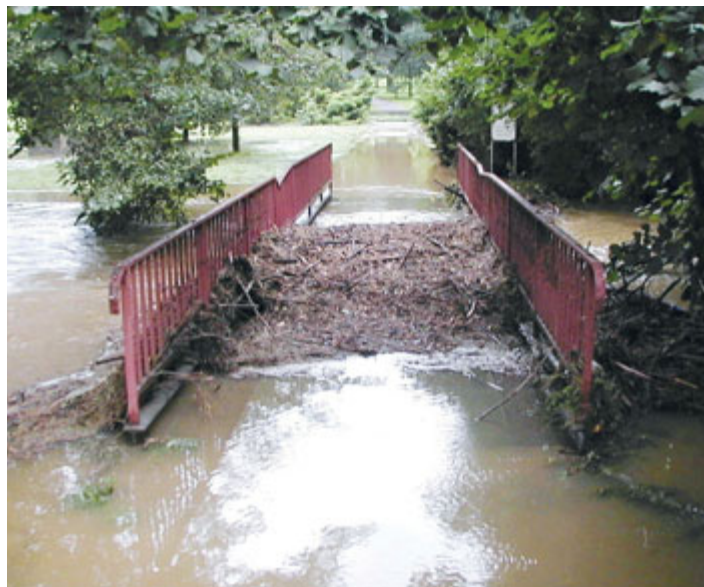
Lávka v parku Bažantnice.