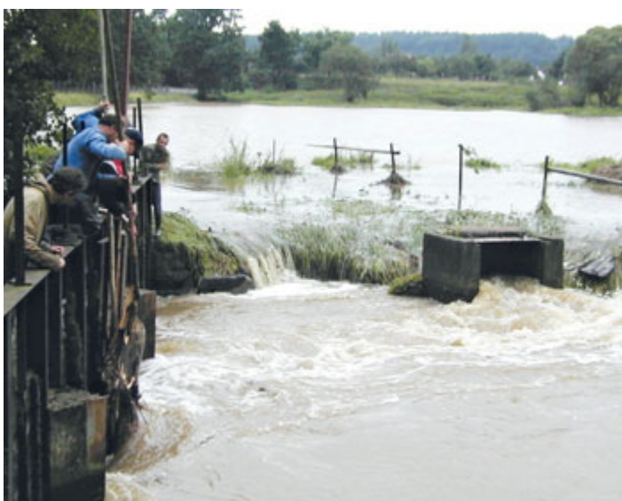
Stavidla u rybníku Koruňáku.