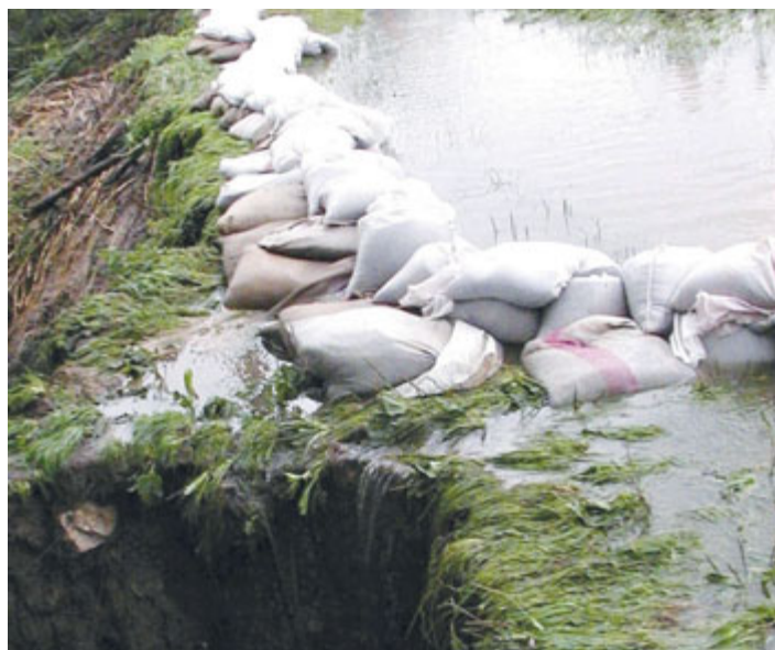
Milevsko, Na Vinicích, hráz Koruňáku.