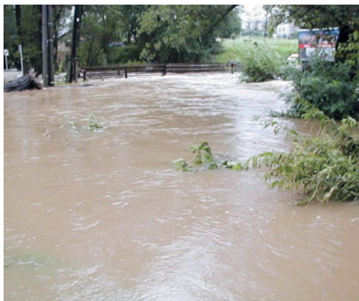
Můstek v Milevsku u prodejny stavebnin.