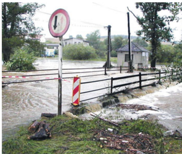
Můstek přes Milevský potok.