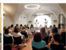
Další skvělé Listování v kavárně Za oknem.