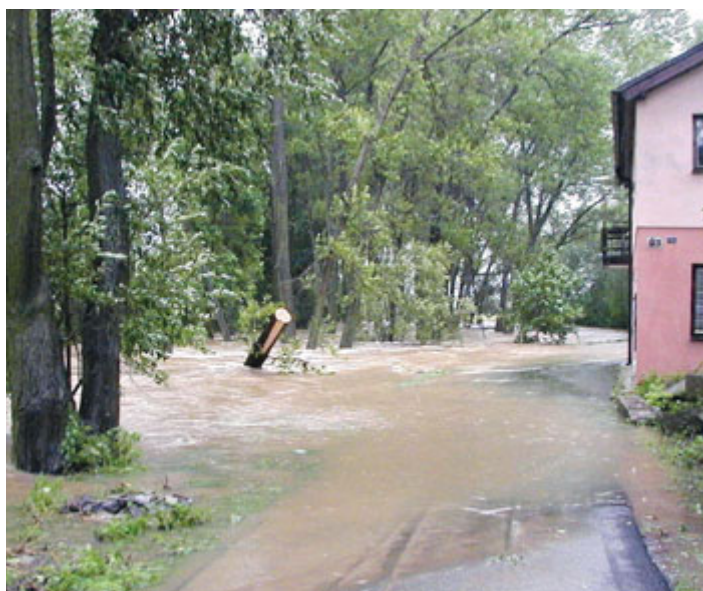
Milevský potok nedaleko můstku.