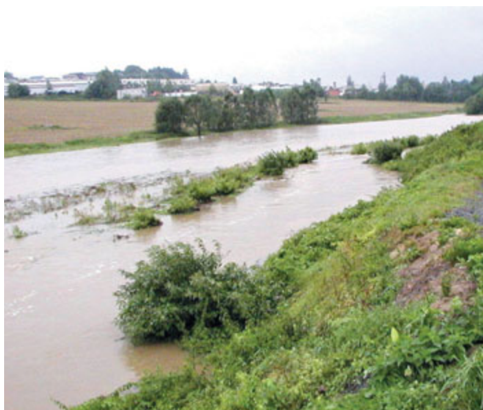
Milevský potok u výpadovky na Tábor.