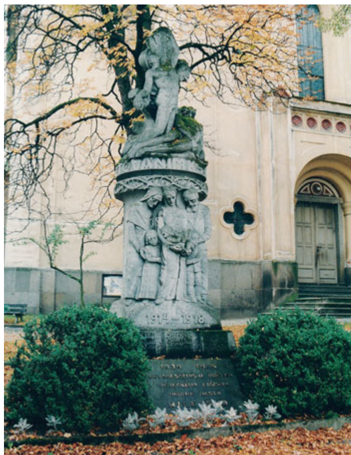
Pomník před jeho restaurováním v roce 2008.