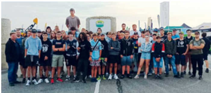
V polovině září se v obci Kámen uskutečnila oblíbená celostátní výstava Den zeměděle a žáci milevského učiliště na ní rozhodně nemohli chybět.