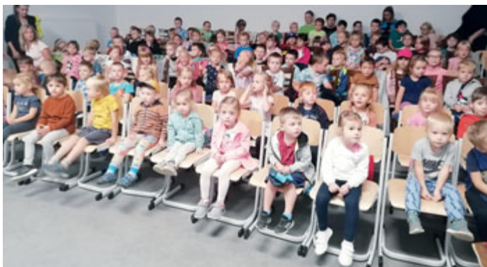
Loutkový soubor při DK Milevsko sehrál ve čtvrtek 21. září celkem tři představení pohádky Trpasličího tajemství pro děti z mateřských škol a pro prvňáčky škol základních.