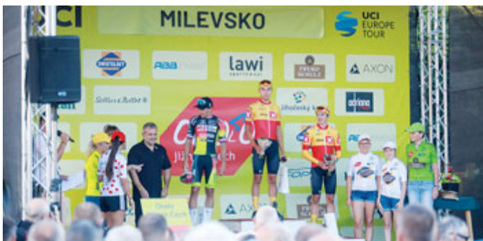
Milevsko se stalo cílovým městem první etapy desátého ročníku mezinárodního cyklistického závodu Okolo jižních Čech, který se konal od 7. do 10. září. Příjezdu cyklistů předcházela doprovodný kulturní program na nám. E. Beneše.