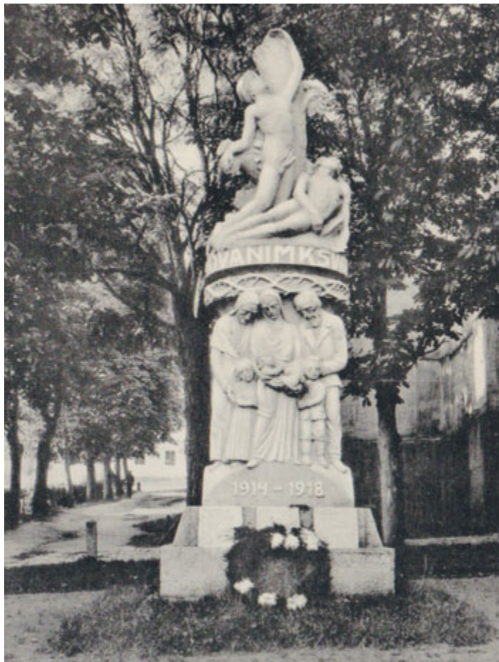
Pomník padlým – dvacátá léta minulého století

Letos v říjnu tomu bude již 100 let, kdy byl na náměstí Edvarda Beneše před kostelem sv. Bartoloměje odhalen pomník padlým první světové války. Kostel sv. Bartoloměje je obklopen parkem, který byl zřízen již okolo novostavby kostela roku 1869. Tehdy bylo prostranství kolem kostela srovnáno a byly zde vysázeny stromy – hlavně lípy a kaštaný.