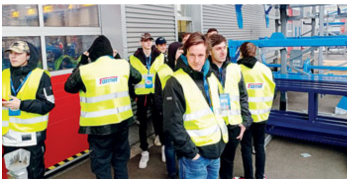
Podnik Farmet z daleké České Skalice, který se specializuje na vývoj a výrobu zemědělských strojů, připravil pro učně z SOŠ a SOU Milevsko zajímavý výukový program.