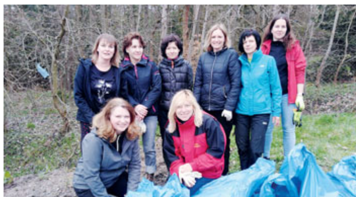
Téměř 40 zaměstnanců milevského městského úřadu se ve čtvrtek 20. dubna zúčastnilo úklidové akce, při které sbírali odpady v lesích kolem našeho města, konkrétně na Hajdě, ve Velké a pod skládkou Jenišovice a dále také kolem vodoteče od Penny marketu až k Suchanovu rybníku.