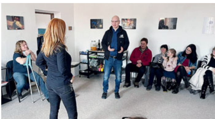
Ve čtvrtek 13. dubna byla v Komunitním centru Milevsko zahájena unikátní výstava fotografií hudebního fotografa Jana Nožiky pod názvem „NA TURNĚ“. Vernisáž byla doplněna autorovým vyprávěním a zážitkami z focení velkých českých i zahraničních kapel. O hudební doprovod večera se postarala děvčata ze ZUŠ Milevsko.