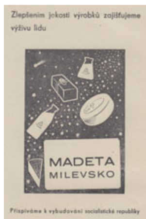
Dobový reklamní tisk z roku 1950.

Výměrem Okresního národního výboru v Táboře byla na Madetu dnem 3. března 1948 zavedena v pořadí již druhá národní správa. V tomto roce mlékárna přijala přes 3 miliony litrů mléka. Z důvodu nedostatku píče odváděli zemědělci průměrně 6 tisíc litrů, v letních a podzimních měsících stoupla dodávka zavedením kontingen- tence a s dostatkem zeleného krmiva až na 17 tisíc litrů denně. Mléko bylo sváženo ze sběrných stanic v jednotlivých obcích vlastními nákladními automobily Madety.