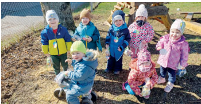
Ve čtvrtek 6. dubna si děti z jeslíček Milísek užily hledání velikonočního překvapení. Velikonoční zajiček ukryl pro každého z nich na zahradě poklad v podobě sladké odměny.