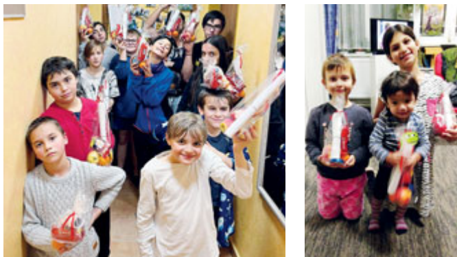
Na snímku vlevo jsou obdarované děti ze Zvíkovského Podhradí, vpravo pak děti z Domova sv. Alžběty ve Veselíčku.