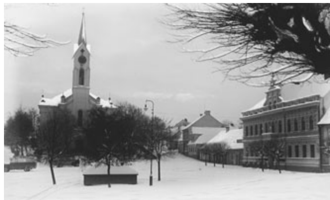
Milevské náměstí v zimě 1939.