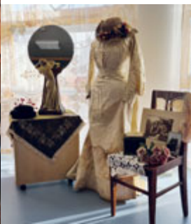
Krásy z půdy – výstava v domově pro seniory

V Domově pro seniory v Milevsku uspořádali v listopadu výstavu Krása z půdy. Exponáty, z velké části původem z rodinných sbírek aktivizačních pracovníků, tvořily ruční práce, oděvy, tiskoviny a předměty přibližně 100 let staré: vyšívání košilk, spodní prádlo, kroje, háčkové kabelky, ubrusy, dečky, svatební šaty. Všichni návštěvníci, kterých bylo více než stovka - babičky i dědečci z Domova pro seniory, obyvatelé DPS, ženy z Klubu seniorů a další obdivovali práci našich předků. Záměrem aktivizačních pracovníků bylo zpříjemnit všem podzimní období, a to se povedlo. Hned po ukončení výstavy přišel do domova pro seniory adventní čas. První týden potěšilo obyvatele vánoční vystoupení předškoláků z MŠ Sluníčko a o týden později si všichni zazpívali koledy s Milevským dětským sborem. Dále se potěšili vystoupením souboru Kovářovan, vánoční nadílkou ze Stromu splněných přání a přivítali milevské skauty, kteří již tradičně za zpěvu koled přinesli betlémské světlo. A nebyla to jen vystoupení, obyvatelé domova se scházeli s aktivizačními pracovní-