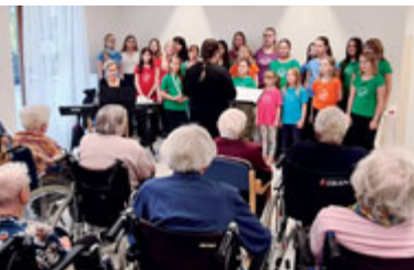
Milevský dětský sbor - Česko zpívá koledy.

V Domově pro seniory v Milevsku uspořádali v listopadu výstavu Krása z půdy. Exponáty, z velké části původem z rodinných sbírek aktivizačních pracovníků, tvořily ruční práce, oděvy, tiskoviny a předměty přibližně 100 let staré: vyšívání košilk, spodní prádlo, kroje, háčkové kabelky, ubrusy, dečky, svatební šaty. Všichni návštěvníci, kterých bylo více než stovka - babičky i dědečci z Domova pro seniory, obyvatelé DPS, ženy z Klubu seniorů a další obdivovali práci našich předků. Záměrem aktivizačních pracovníků bylo zpříjemnit všem podzimní období, a to se povedlo. Hned po ukončení výstavy přišel do domova pro seniory adventní čas. První týden potěšilo obyvatele vánoční vystoupení předškoláků z MŠ Sluníčko a o týden později si všichni zazpívali koledy s Milevským dětským sborem. Dále se potěšili vystoupením souboru Kovářovan, vánoční nadílkou ze Stromu splněných přání a přivítali milevské skauty, kteří již tradičně za zpěvu koled přinesli betlémské světlo. A nebyla to jen vystoupení, obyvatelé domova se scházeli s aktivizačními pracovní-